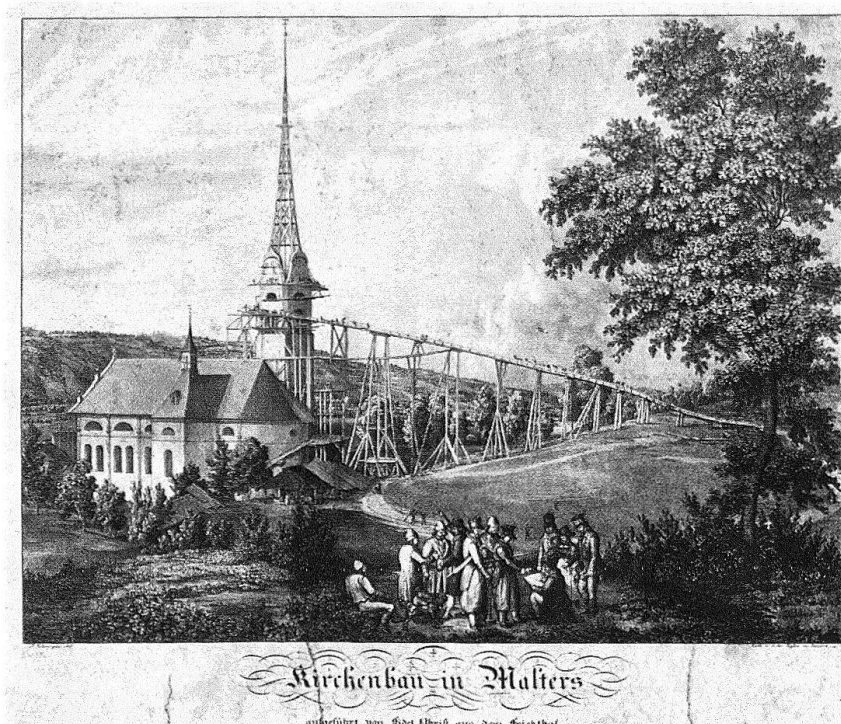
Malters. Kirchenbau von 1833–1835 mit eindrucklicher Gerüstbrücke für den Turmbau (seltene Darstellung). Zeichnung von J. Schwegler, Lithographie von den Gebr. Eglin in Luzern.

«Veraltet» wirken zu dieser Zeit auch die Anlage des Treppenhauses in einem separaten, aus der Fassade vorspringenden Turm und die Zweiteilung der Fenster im obersten Geschoss durch Steinsäulen. In der reizvollen Gesamtwirkung dieser gekonnten Synthese von an sich konträren Grundgedanken zeigt sich das hohe Mass künstlerischen Vermögens des Baumeisters.