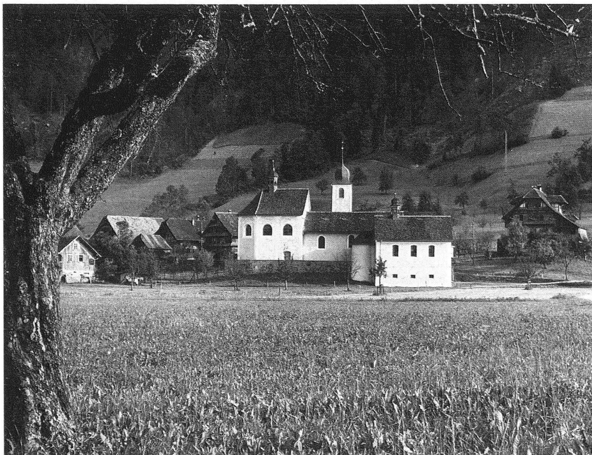
Blatten. Wallfahrtskirche St. Jost. Gesamtansicht von N mit (rechts aussen) Kaplanei

Mit gut einem Jahrhundert Verspätung erreichen die neuen Baugedanken der italienischen Renaissance die erste Stadt an der Gotthardroute nördlich der Alpen. Um so nachhaltiger prägen sie das Antlitz der Stadt in einer weitaus geringeren germanischen Umformulierung, als das in anderen Schweizer Städten geschehen ist. Den Auftakt bildet der 1557 nach florentinischen Palazzo-Vorbildern für Schultheiss Lux Ritter erbaute Palast (heute Regierungsgebäude) mit seiner wehrhaft anmutenden Bossenquaderfassade, dessen vierseitig von mehrgeschossigen Arkaden umstandener Lichthof zum typischen Merkmal der neuen Paläste wird, mit denen das Stadtpatriziat dem Schultheissen nacheifert. Zu den schönsten gehört der dreiseitige Säulenhof des Gödlin-Hauses am Hirschenplatz 12 und das eben restaurierte Am-Rhyn-Haus, dessen Fassade der Furrengasse einen südländischen Einschlag vermittelt. Die Reihe dieser für die Schweiz einmaligen Bauten ist noch bis in jüngste Zeit durch allzu tüchtigen Geschäftssinn empfindlich dezimiert worden. Das neben dem Ritterschen Palast bedeutendste Werk der Renaissance entsteht mit dem 1602–1606 von Anton Isenmann aus Prismell (Oberitalien) erbauten Rathaus, einer eigenartigen Verschmelzung italienischer Formen mit einheimischer Bautradition. Italienisch ist letztlich nur die Fassadeninstrumentierung des Baukörpers, dem ein behäbig ausladendes Dach aufgesetzt ist. Verstärkt wird die einheimische Komponente durch den vom Vorgängerbau übernommenen Uhrturm.