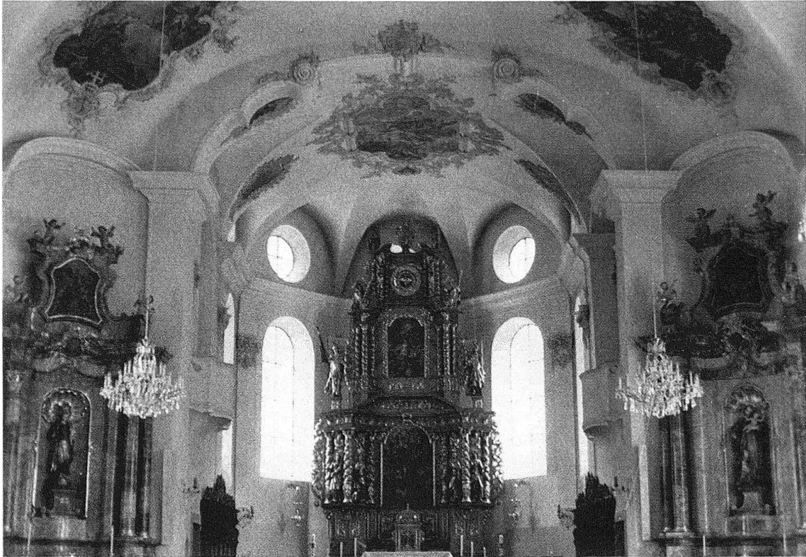
Abb. 5. Silenen. St. Albin, 1754–1756 als Einheitsraum erbaut