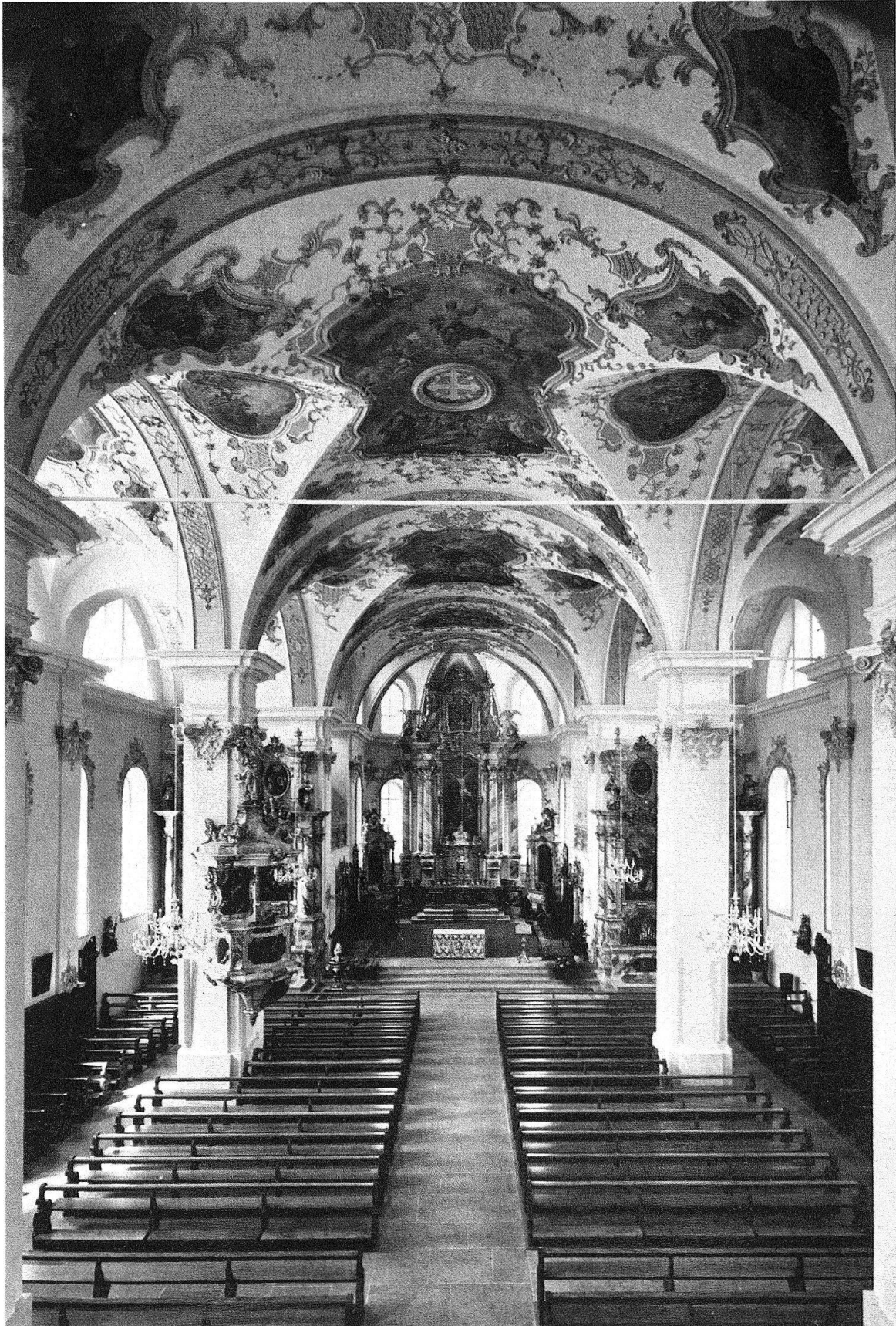
Abb. 1. Sarnen. Pfarrkirche St. Peter, 1739–1742 erbaut von Franz Singer