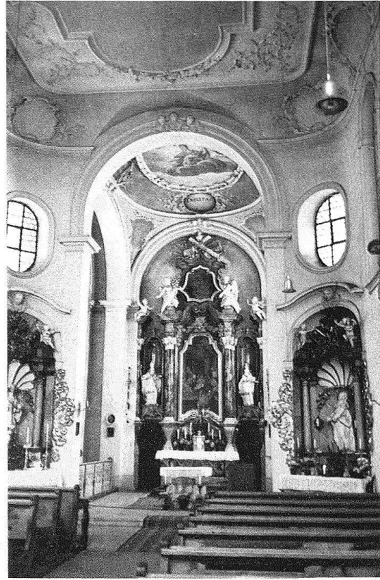
Abb. 4. Füssen. Krippkirche, 1717 von Johann Jakob Herkomer

künstlerischen Umkreis verband. Hatte der architekturinteressierte und erfahrene Bauherr Imfeld wahrscheinlich schon die Entwürfe von Brüels beeinflusst, so gilt seine aktive Beteiligung an der endgültigen Planung und Ausführung der Kirche als sicher, denn er stand nicht nur mit seinem baufreudigen Bruder, dem Fürststab Niklaus Imfeld von Einsiedeln, in engem Kontakt, sondern er setzte auch sein ambitiöses Projekt gegen die ängstlichen Beschlüsse der Kirchengemeinde durch. Die ausgeführte Pfarrkirche von Sarnen lässt sich in mehrfacher Hinsicht auf die Vorlagen in Küssnacht und Schwyz zurückführen, zeigt aber auch neue, Singersche Elemente, die hinwiederum die 1769–1774 von Jakob und Johann Anton Singer erbaute Pfarrkirche von Schwyz beeinflussten (Abb. 1).