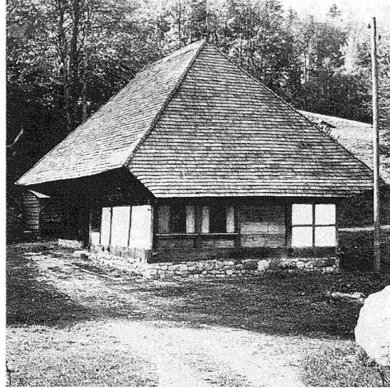
Taunerhaus und Stöckli von Detligen. Die von zwei verschiedenen Heimwesen in Detligen stammenden Bauten bereichern als kleinere Objekte neben dem Restaurant «alter Bären», dem Ostermündiger Haus, dem Madiswiler Hochstadbau, dem Spycher aus Kiesen und der Scheune aus Faulensee die Kammer Bern-Mittelland

dabei entstehen würde, wäre eine vergrösserte «Swiss Miniature» à la Melide, doch ohne die Fähigkeit, innere kulturelle Zusammenhänge deutlich zu machen.