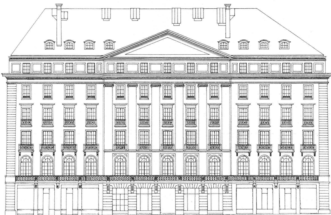
Fig. 6. Genève. Façade principale de l'Hôtel des Bergues relevée par le Bureau d'entraide technique en 1940

Conclusion : l'Hôtel des Bergues fut un des pionniers de l'hôtellerie suisse. Premier établissement de luxe genevois il souhaitait offrir à ses hôtes toutes les commodités alors à l'avant-garde. Un prospectus de publicité de l'hôtel de 1835 et un autre de 1844 12 nous donnent toutes sortes d'indications précieuses sur les avantages dont pouvait bénéficier la clientèle. Les voitures et équipages des voyageurs étaient soignés par des palfreniers. Ceux qui le désiraient pouvaient louer des «calèches à deux chevaux», des «chars à un cheval» ou simplement des «chevaux de selle» pour les promenades et excursions dans les environs. Les journaux et revues étaient à disposition des lecteurs dans les «salons de compagnie chauffés et éclairés» ou dans le «salon de lecture». Les repas se prenaient à la salle à manger à «table d'hôte» ou «en particulier» – ce qui revenait plus cher – et l'on y dégustait des «mets apprêtés à l'anglaise ou à la française». On pouvait aussi se faire servir en chambre. L'hôtel ne comportait, semble-t-il, pas de lieux équivalents à des salles d'eau, puisque les clients prenaient des bains de pied dans leurs chambres. On payait en plus les bougies et les feux de cheminées (chaque chambre était pourvue d'une cheminée) que l'on faisait brûler.