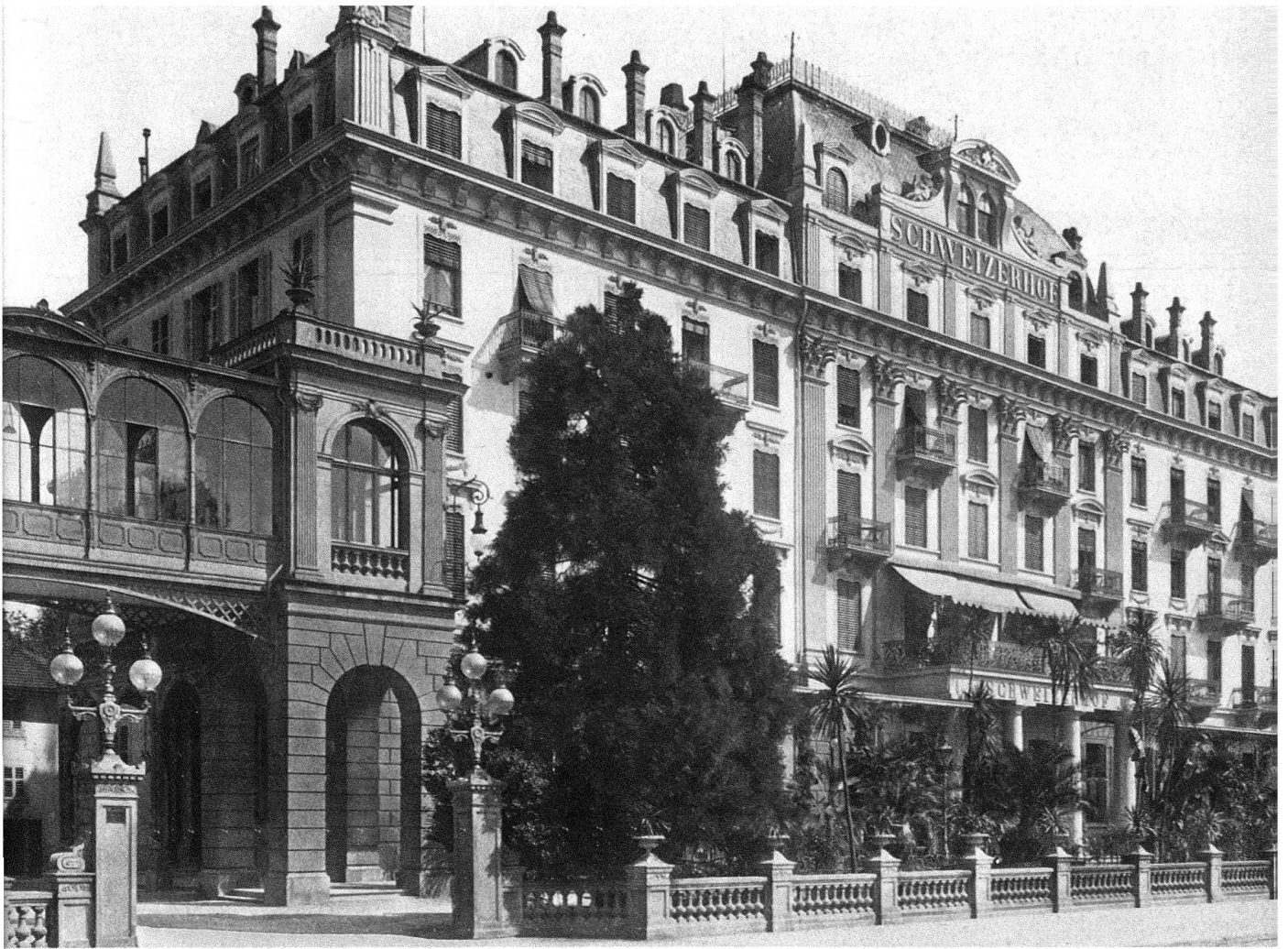
Abb. 2. Luzern. Hotel Schweizerhof. Die Seefassade mit dem Mansardgeschoss von 1885/56 und den Verzierungen der Zeit

Das Hauptgebäude (Abb. 1) wurde 1844/45 errichtet von den Gebrüdern Segesser, welche nebenbei noch das Gasthaus Rigi-Kaltbad betrieben. Die Dépendancen entstanden 1855/56; 1868 wurde die östliche, 1881 die westliche durch eine Passerelle im Obergeschoss mit dem Hauptbau verbunden. 1885/86 erhöhte Architekt Bringolf das Hauptgebäude um ein Mansardgeschoss. Der Mittelrisalit erhielt ein Klostergewölbe als Bedachung. Die Fassade wurde im historistischen Zeitgeschmack verziert (Abb. 2). Die Erhöhung der Dépendancen erfolgte 1898/99. Bei den Restaurationsarbeiten von 1954/55 kam es zur grossen Rasur: im Sinne des Nachkriegspurismus wurden die «Stil»-Dekorationen von 1886 wieder entfernt, um die Architektur dem ursprünglichen Bestand anzugleichen.