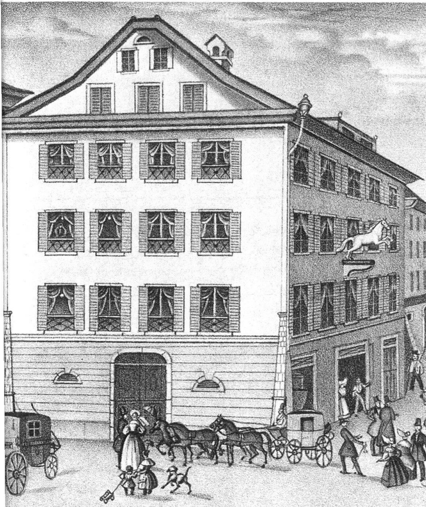
Abb. 7. Luzern. Hotel Rössli, vor dem Umbau von 1899/1900

Neben den Häusern auf neuerschlossenem Baugebiet entstanden im Verlauf des 19. Jahrhunderts auch in der Altstadt grössere Hotelbauten, etwa das Rütli am Untern Hirschengraben (1865) und das Hotel Balance an der Reuss (1810). Einige dieser Gasthöfe können auf eine jahrhundertalte Tradition zurückblicken: das Hotel Rössli am Mühlenplatz – 1467 erstmals erwähnt – gehörte seit jeher zu den renommiertesten Absteigen Luzerns. Die Umgestaltung des alten Gasthofes (Abb. 7) in ein modernes Hotel erfolgte in den Jahren 1899/1900 unter der Leitung von Architekt Meili-Wapf. Der gotisierende Treppengiebel und der dreigeschossige, polygonale Erker mit Zwiebelhelm an der Südwestflanke des Neubaus bildeten einen malerischen Abschluss des Weinmarktplatzes gegen Osten (Abb. 8). Nicht lange erfreute sich der Gasthof seiner neuen Gestalt. Die langwierige Krise des Tourismus in der Zeit der beiden Weltkriege machte dem Betrieb schwer zu schaffen. 1942 wurden im Rahmen des städtischen Notstandsprogramms aus den 70 Hotelzimmern 28 Wohnungen für Obdachlose gemacht. 1946 wich das Gebäude dem Bau des Warenhauses EPA.