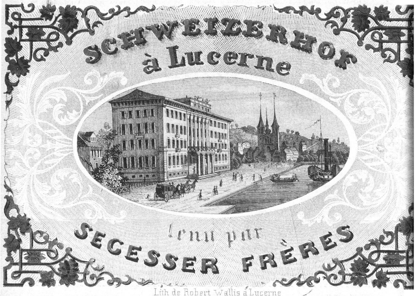
Abb. 1. Luzern. Hotel Schweizerhof. Das Hauptgebäude von 1844/45 (zeitgenössischer Prospekt)

1 Stadtarchiv Luzern: B3.29.363, Nationalquai (1853–1865)