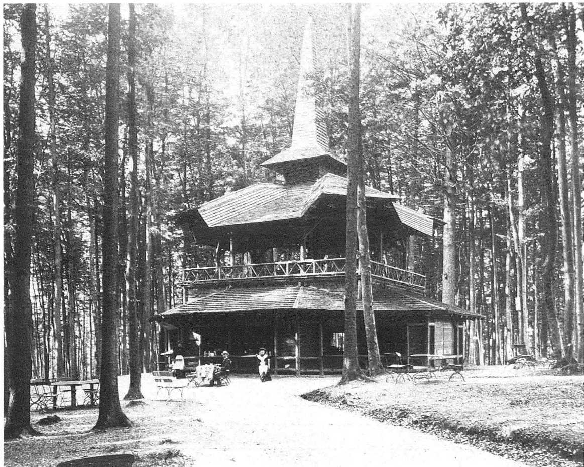
Zürich. Dolderpark. Restaurations-Pavillon, 1897 erbaut

Nun ging es Schlag auf Schlag. Schon im September 1894 erhielt Ing. Ulrich Bossard den Auftrag zum Bau der Dolderbahn . Am 23. Juni des gleichen Jahres wurde der Architekt Jacques Gros damit betraut, eine Restaurationsbaute mit Bergstation samt Umgelände zu erstellen. Der Prospekt von 1892 hatte mit Kosten von Fr. 70 000.– gerechnet, «der Verwaltungsrat kam aber alsbald zur Überzeugung, dass es ein Fehler wäre, das Unternehmen in kleineren Dimensionen zu halten, dass vielmehr nur mit einem grossen und wenn auch einfachen doch hübsch gehaltenen Etablissement den Interessen der Gesellschaft gut gedient würde» 6 . Die Kosten sollten sich also nun auf Fr. 160 000.– beziffern.