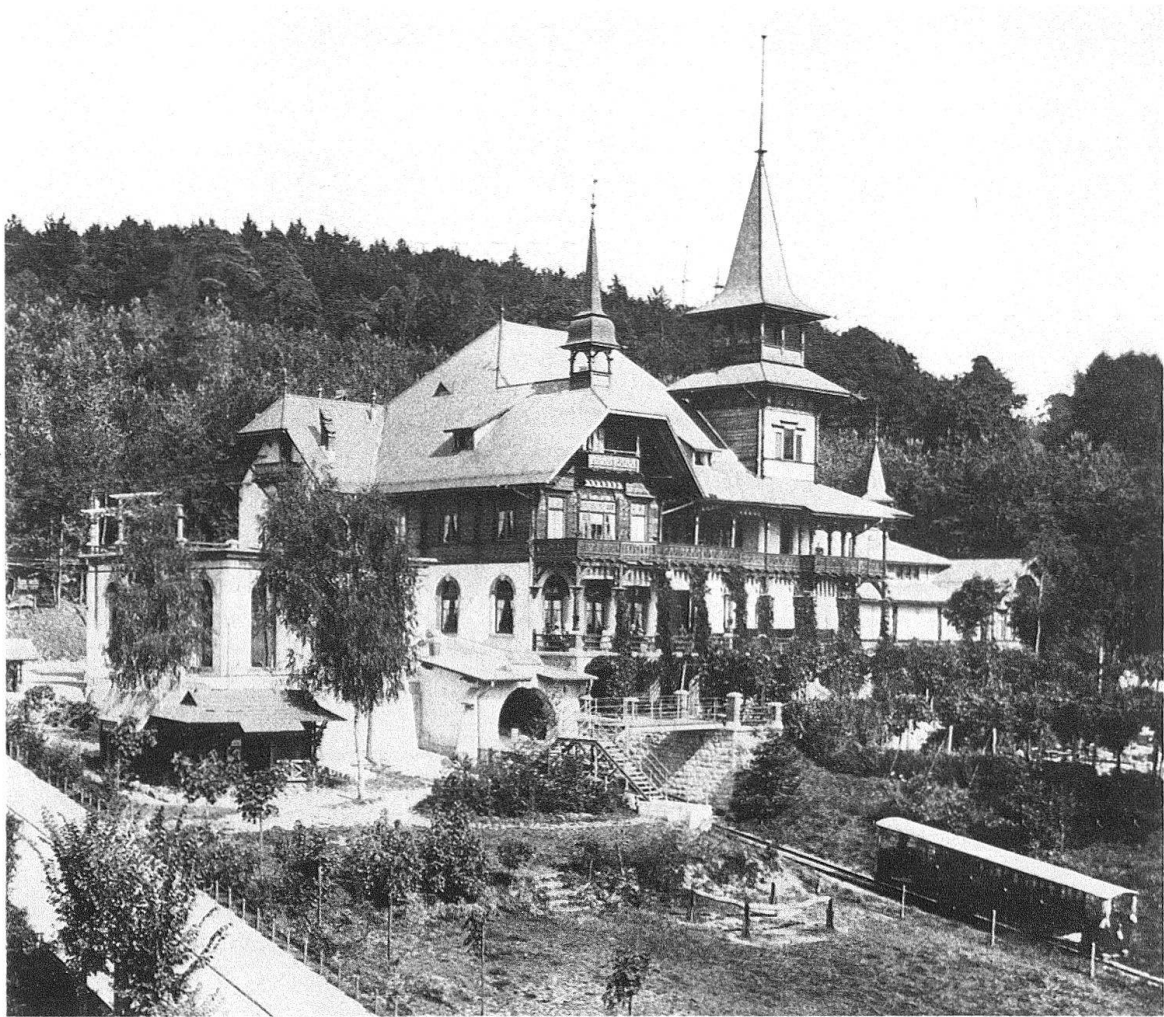
Zürich. Waldhaus Dolder, Stations- und Restaurationsgebäude, 1894 erbaut, 1972 abgetragen

Der «Prospect» schilderte zuerst Grösse und Schönheit der «wachstumsfreudigen» Stadt Zürich, um – nach einem kurzen Schreckensbild der «nervenerschütternden Massen-Eindrücke des Erwerbslebens» – das ganze Begriffsarsenal von Naturschönheit, Erholung und Erhebung durch die Natur zu evozieren.