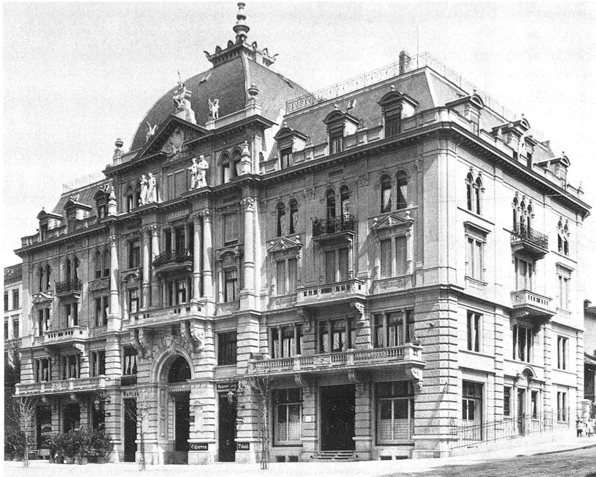
Zürich. «Römerhof», Talstation der Dolderbahn, 1898–1900 erbaut (Foto von 1901)

soll das Wallfahrtsziel werden von Vereinen, für Schulen und Gesellschaften» 11 . Entsprechend dieser Zielsetzung wurde 1897 mit der Einrichtung des Parkes begonnen. Auch ein Restaurations-Pavillon mit Abort, Wein- und Bierkeller wurde errichtet. Jacques Gros verhielt sich ganz gemäss der romantischen Tradition. Aus Rundholz (Baumstämme) konstruiert und mit Holzschindeln abgedeckt, entstand jene Mischung aus Lusthäuschen und Waldkapelle.