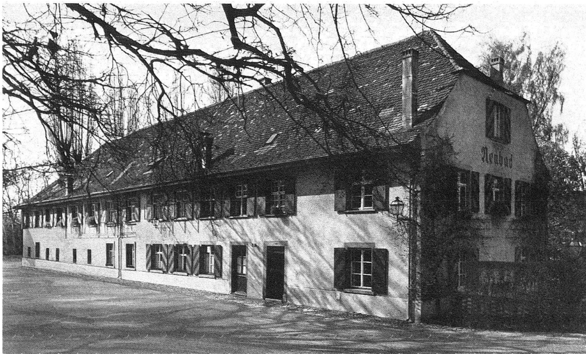
Binningen. Das Neubad in der Gestalt des 18. Jh. (oben) und in der heutigen Form