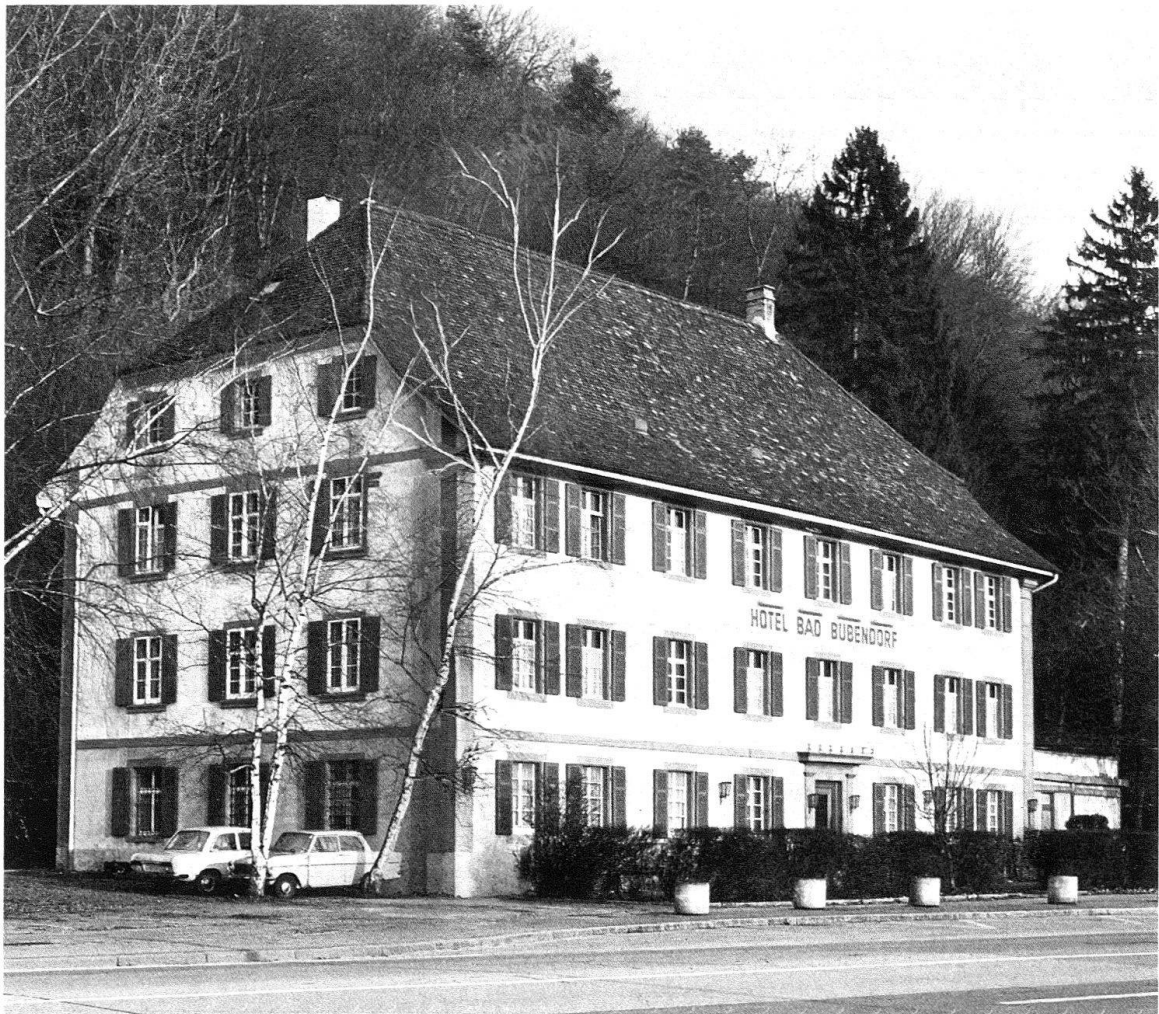
Bubendorf. Das Bad spielte im 19. Jh. die Rolle des «basellandschaftlichen Rütli»; nach 1763 erbaut und zu Beginn des 19. Jh. erweitert

Erst im Laufe des 17. Jahrhunderts entstanden bei zahlreichen neuentdeckten Quellen sogenannte Badhäuser mit Gastwirtschaften. Diese konnten sich anfangs nur mit Mühe gegen die Behörden und die Wirte durchsetzen, war es doch Mode geworden, dass nun auch die Städter teils aus Gesundheitsgründen und teils zum Vergnügen die Bäder auf der Landschaft aufsuchten. Man flüchtete sich zum in der Stadt verbotenen Spiel und Tanz in die Anonymität der Bäder auf dem Lande, so wie heute Landbewohner die Anonymität der Städte mit ihren Bars, Dancings und Nachtclubs suchen.