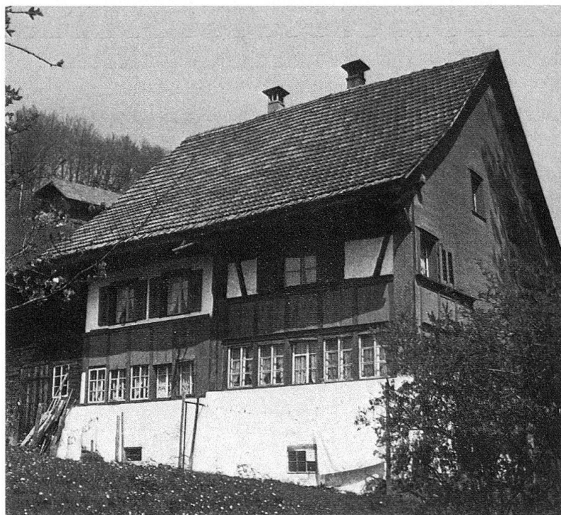
Wald, Hiltisberg, in der ersten Hälfte des 18. Jahrhunderts zum Heimarbeiterhaus umgebautes Doppelbauernhaus

In ihrer Herkunft und Verbreitung folgt diese Heimarbeiterkultur den gleichen Wegen wie ihre materielle Grundlage. Als Ausgangspunkt und stilistische Vorbilder bieten sich die Prunkelemente ländlicher Herrschaftsarchitektur des 17. Jahrhunderts an. Es sind die Bauten jener Müller, Grossbauern und Unternehmer, die als Vermittler