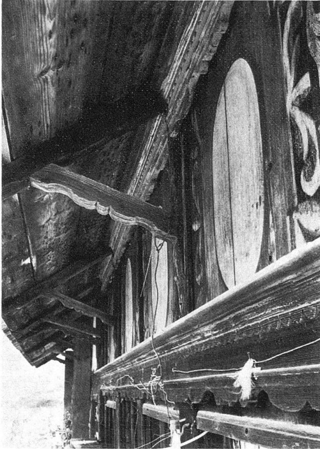
Wald. Schauffassade des Grossbauernhauses auf der Hueb, frühes 18. Jh.

tionsgemeinschaft über eine eigene Wohnung verfügen muss, lässt sich parallel zu dieser Entwicklung ein Anwachsen des Baubestands verfolgen. So verdoppelt sich in den meisten Ortschaften des oberen Tösstals und des Allmengebietetes die Zahl der Häuser zwischen 1680 und 1780 5 .