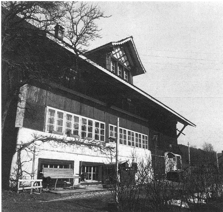
Bauma. Vorder Tiefenbach. Heimarbeiter- und Kleinbauernhaus von 1785. Webkeller im Untergeschoss des linken Haus-teils, Stallanbau an die rechts liegende Wohnung angefügt

zwischen Stadt und Landschaft auch deren Industrialisierung in die Wege leiten. Mühlen, wie die Mannenbergmühle von 1675 in Effretikon, oder Gutshöfe, wie die Anlage aus der Zeit um 1700 auf der Hueb bei Wald, liessen die Formensprache des ländlichen Barock im Zürcher Oberland heimisch werden. Die Vorbilder für diese stilistischen Innovationen sind im Zürichseeraum zu suchen, von hier stammten auch die meisten Familien der neuen Oberschicht oder suchten zumindest durch Versippung in diesem blühenden Wirtschaftsraum nach Rückhalt und Identität.