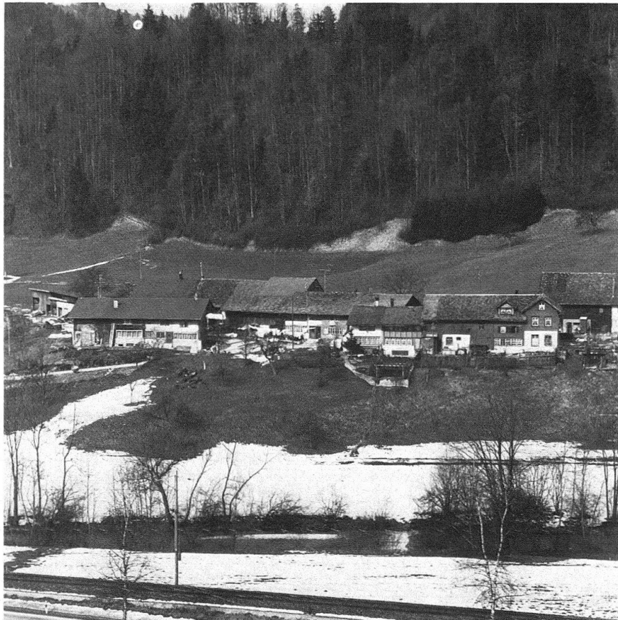
Bauma. Der Weiler Wellenau