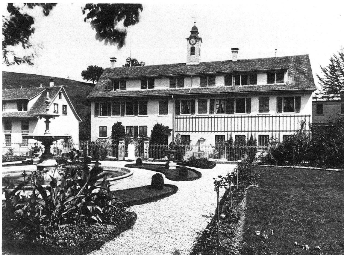
Bäretswil-Neuthal. Wohnhaus von 1835 mit Parkanlage. Bestand um 1900