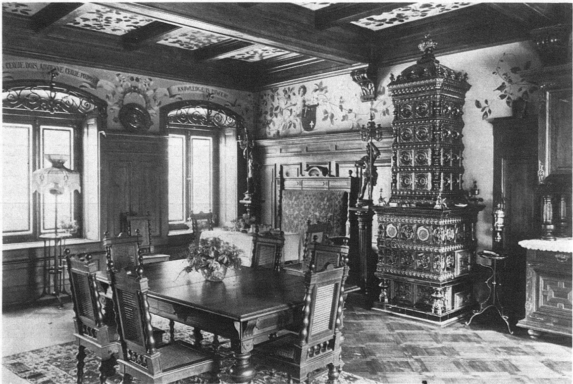
Bäretswil-Neuthal. Neurenaissancezimmer, um 1880. Bestand um 1900