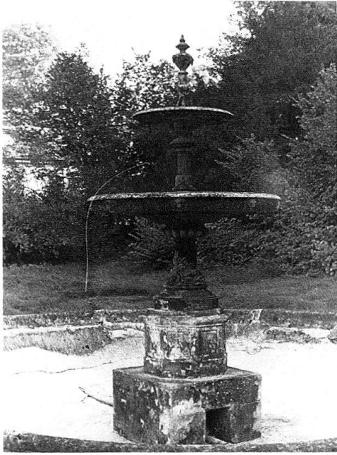
Bäretswil-Neuthal. Italienischer Brunnen. Gusseisen, um 1860–1870