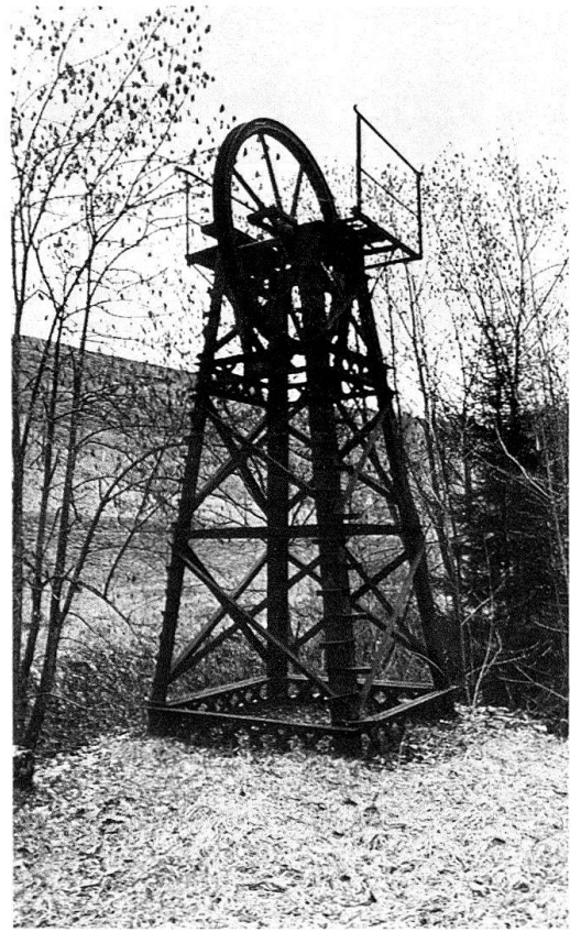
Bäretswil-Neuthal. Kraftübertragungstürme von 1879

gebildetes Gartenhäuschen dem flüchtigen Betrachter Tempelchen-Assoziationen. Bereits in der «wilderer» Zone des Parkes ist der letzte der Kraftübertragungstürme als neugotischer, massiver Turm mit Zinnenkranz ausgeformt. Die dazwischen liegenden Türme im Bereich des Parkes sind hingegen markante Eisenkonstruktionen rein technischen Gepräges. Der Turm ist nicht das einzige neugotische Stilelement der Gesamtanlage: das 1869 errichtete Werkstattgebäude, der Garant für die Betriebssicherheit der neuen technischen Anlagen, liess die Bauherrschaft als «Kapelle» gestalten. Spitzbogen- und Rundfenster über dem Eingang (hier mit neugotischem Masswerk) suggerieren diese Assoziation.