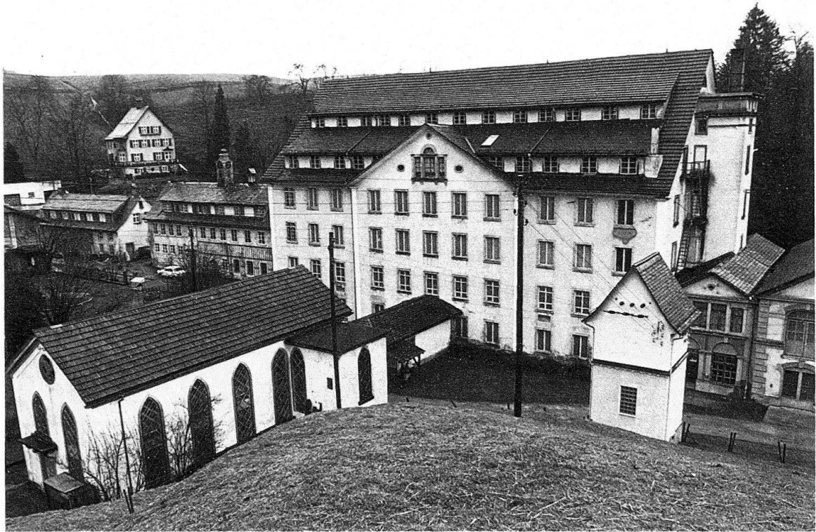
Bäretswil-Neuthal. Guyer-Zeller-Gut. Gesamtanlage. Fabrik von 1827, Wohnhaus (links) 1835, Werkstätte (vorn), 1869