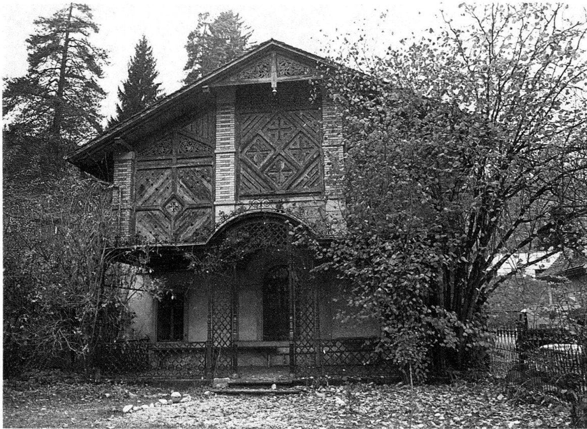
Bäretswil-Neuthal. Ökonomiegebäude von 1865 mit Eisenlaube