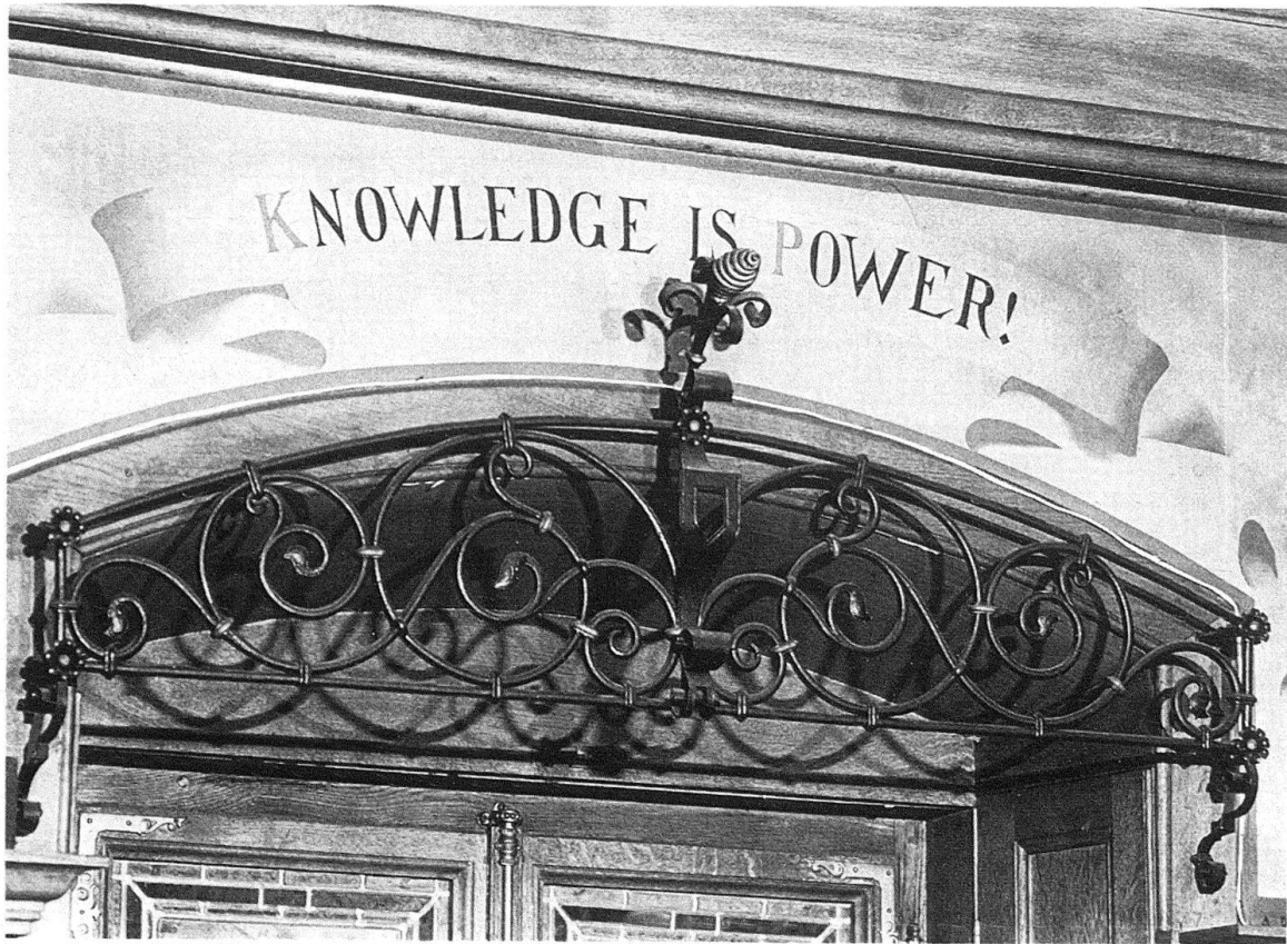
Bäretswil-Neuthal. Renaissancezimmer, um 1880. Wahlspruch über dem Fenster

Als Gesamtanlage – zusammen mit den Stausystemen und Kraftübertragungsbauten – ist das Neuthal heute im Kanton Zürich das besterhaltene Dokument einer Fabrikanlage des mittleren 19. Jahrhunderts, die alle ihre Teile ablesbar und damit auch für heute erlebbar erhalten hat: allein das verpflichtet in verschiedener Hinsicht.