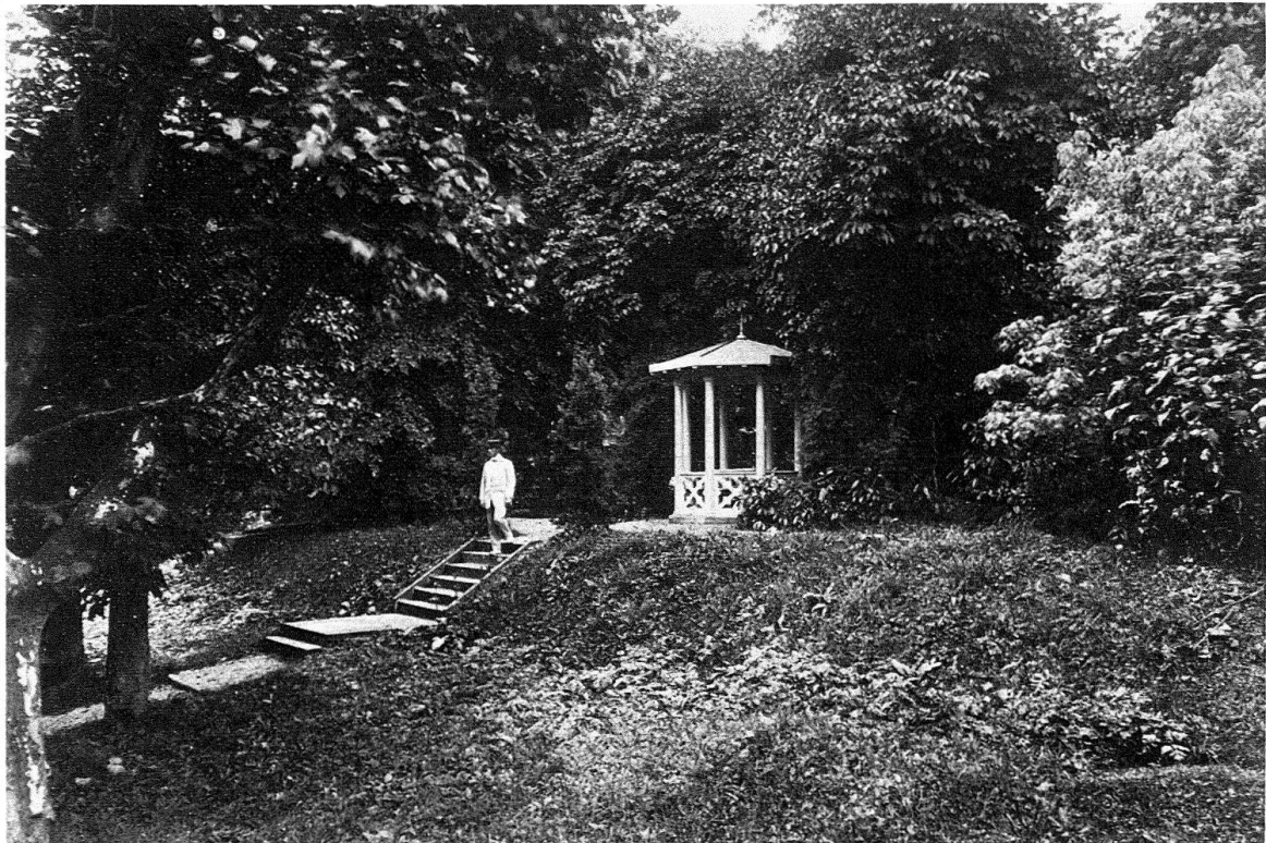
Bäretswil-Neuthal. Parkanlage mit Achteck-Tempelchen. Bestand um 1900