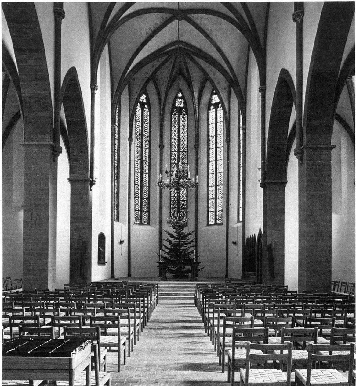
Basel. Predigerkirche. Das Altarhaus mit den abgedeckten Gewölbemalereien (zur Weihnachtszeit) nach der Restaurierung

tet an einer bevorzugten Stelle: man erblickt sie von Norden her im Grossbasler Rhein- uferbild durch eine Häuserlücke. Ihr straff und einheitlich geformter Baukörper tritt auch dort in seiner ganzen Eigenart in Erscheinung, obwohl ihr gerade durchlaufenden First die Häuserreihe am Stromufer nur wenig überragt. Doch schwebt der zierliche, sandsteinerner Glockenträger wie ein Echo auf die beiden Münstertürme (und diesen in der durchbrochenen Feinteiligkeit absolut ebenbürtig) über den Dächern. Damit erlangt neben den hoch auf den Hügeln stehenden und breitausladenden Pfarrkirchen mit ihren stämmigen Turmschäften auch dieser Sakralbautyp des mehr in der Taltiefe gelegenen Klostersgotteshauses im Basler Stadtbild die ihm gebührende Mitsprache. Nicht unerwähnt sei auch, dass die einstige Mönchskirche einen jener alten historischen