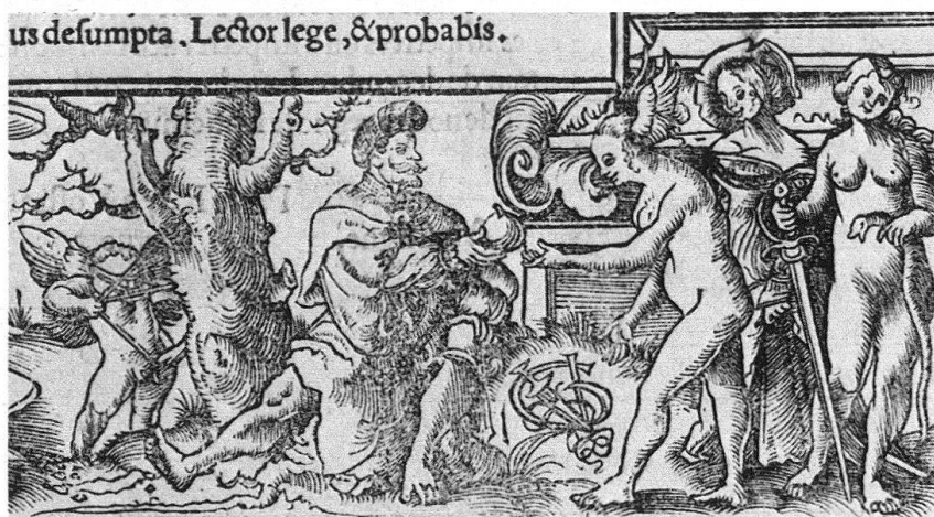
Urs Graf. Detail «Das Urteil des Paris» aus einem Titelblatt; Holzschnitt, 1519