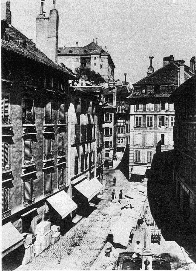
Fig. 2. Lausanne. Maison de Force à Bétusy. Loggia méridionale du corps central (peu avant la démolition) ▷