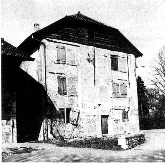
Château de Genthod, façade principale avant restauration