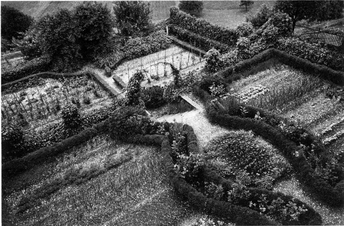
Baselbieter Bauerngarten. Hofgut Marchmatt bei Reigoldswil

18. Jahrhundert lieferten Italien und Frankreich die formalen Grundlagen für den Barockgarten, dessen strenge Geometrie sich bis heute in den Bauerngärten und in den Herrschaftsgärten der Schlösser und Landsitze erhalten hat.