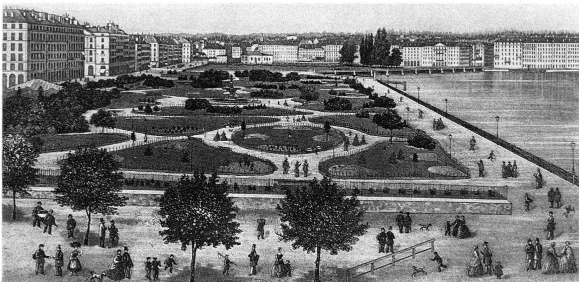
Genf. Jardin anglais, angelegt 1854 auf dem Gelände der früheren Fortifikationen

Als Reaktion auf den geometrischen Barockgarten folgte auch in der Schweiz – angeregt durch die Schriften von Albrecht von Haller, von Jean-Jacques Rousseau und