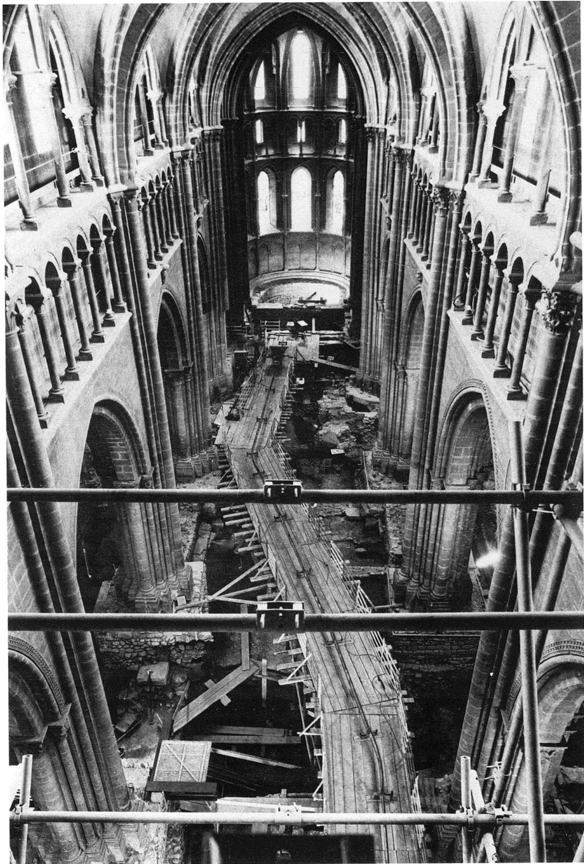
Fig. 1. Genève. Cathédrale St-Pierre. Les fouilles à l'intérieur