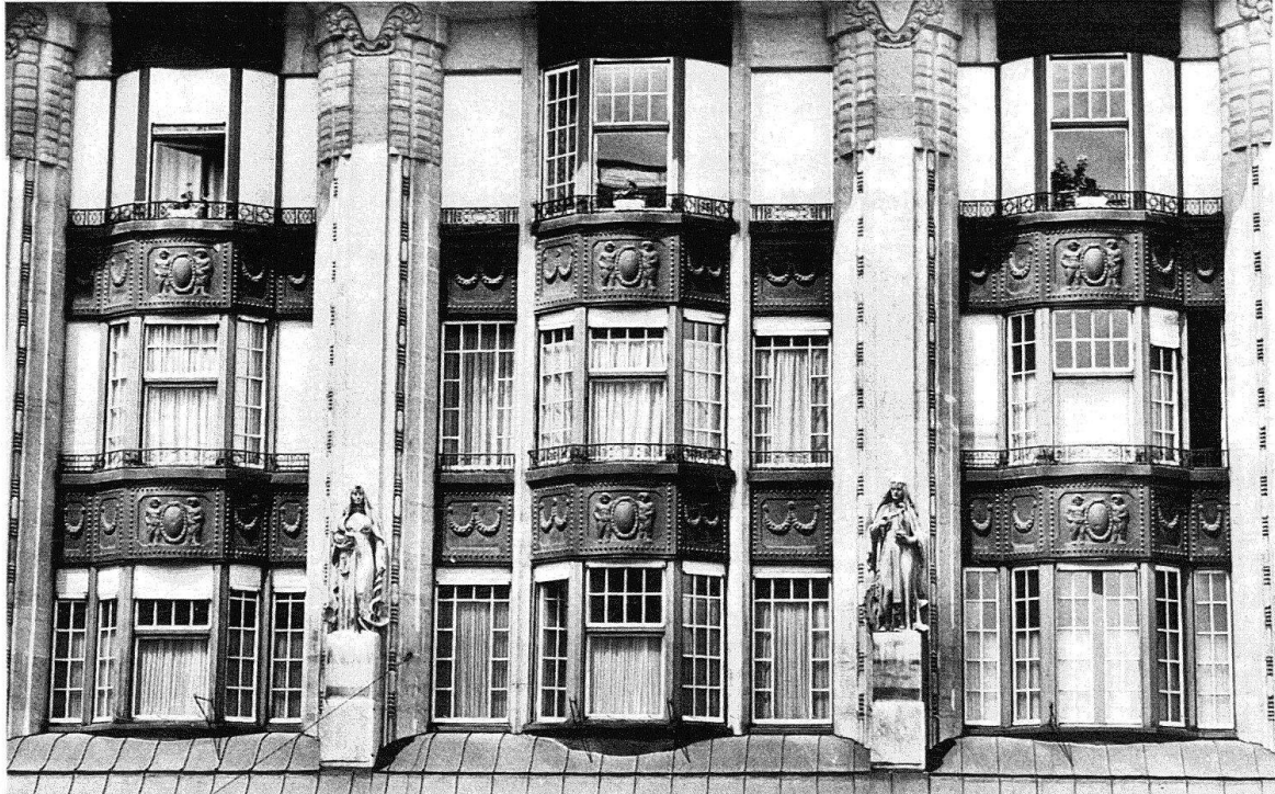
Lausanne. Galerie Saint-François, façade sud (1907/08). Georges Epiteaux et J. Austermeier architectes. Les statues allégoriques du Commerce et de l'Industrie affichent la vocation de ce passage en forme de galerie