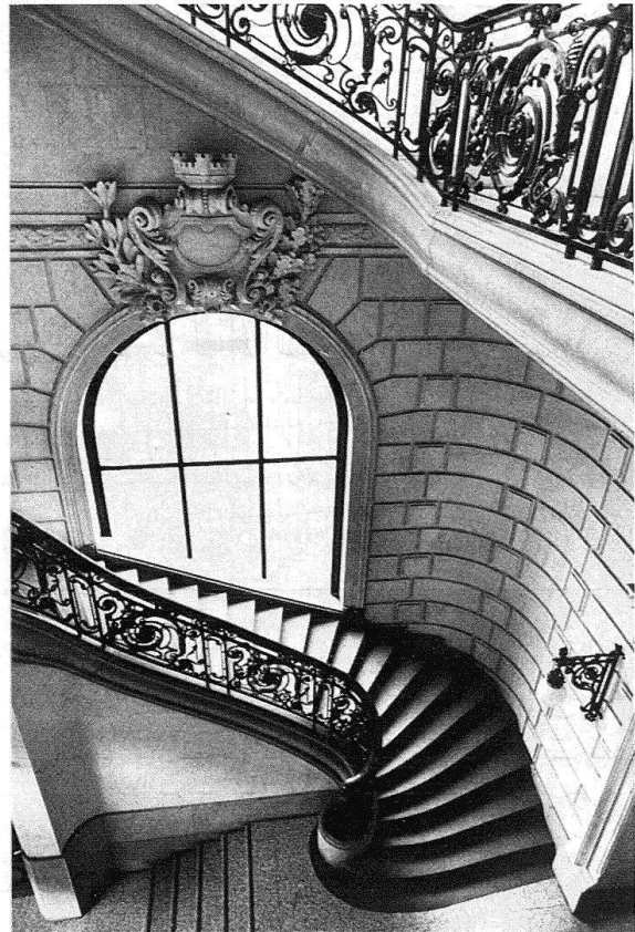
Lausanne. Hôtel des Postes (1896–1900). Eugène Jost, Bezencenet et Girardet architectes. Doctrine esthétique de l'historicisme, avec des allures d'un château de la Renaissance française. – Grand escalier, avec fers forgés de Louis Zwahlen d'après les plans de Bezencenet