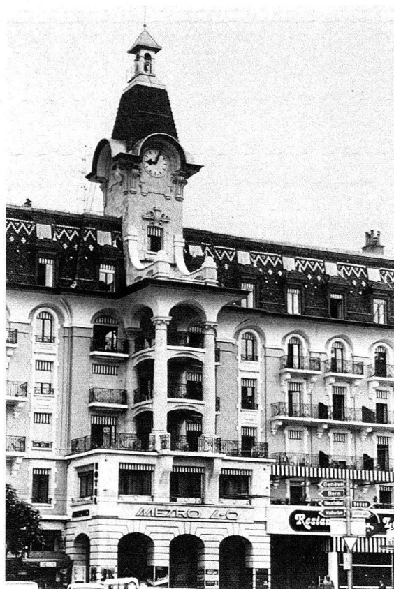
Lausanne-Ouchy. A gauche: Hôtel Beau-Rivage, annexe 1908, grande coupole, vitraux par E. Diekmann. – Ancien Hôtel du Parc (1906) par Francis Isoz