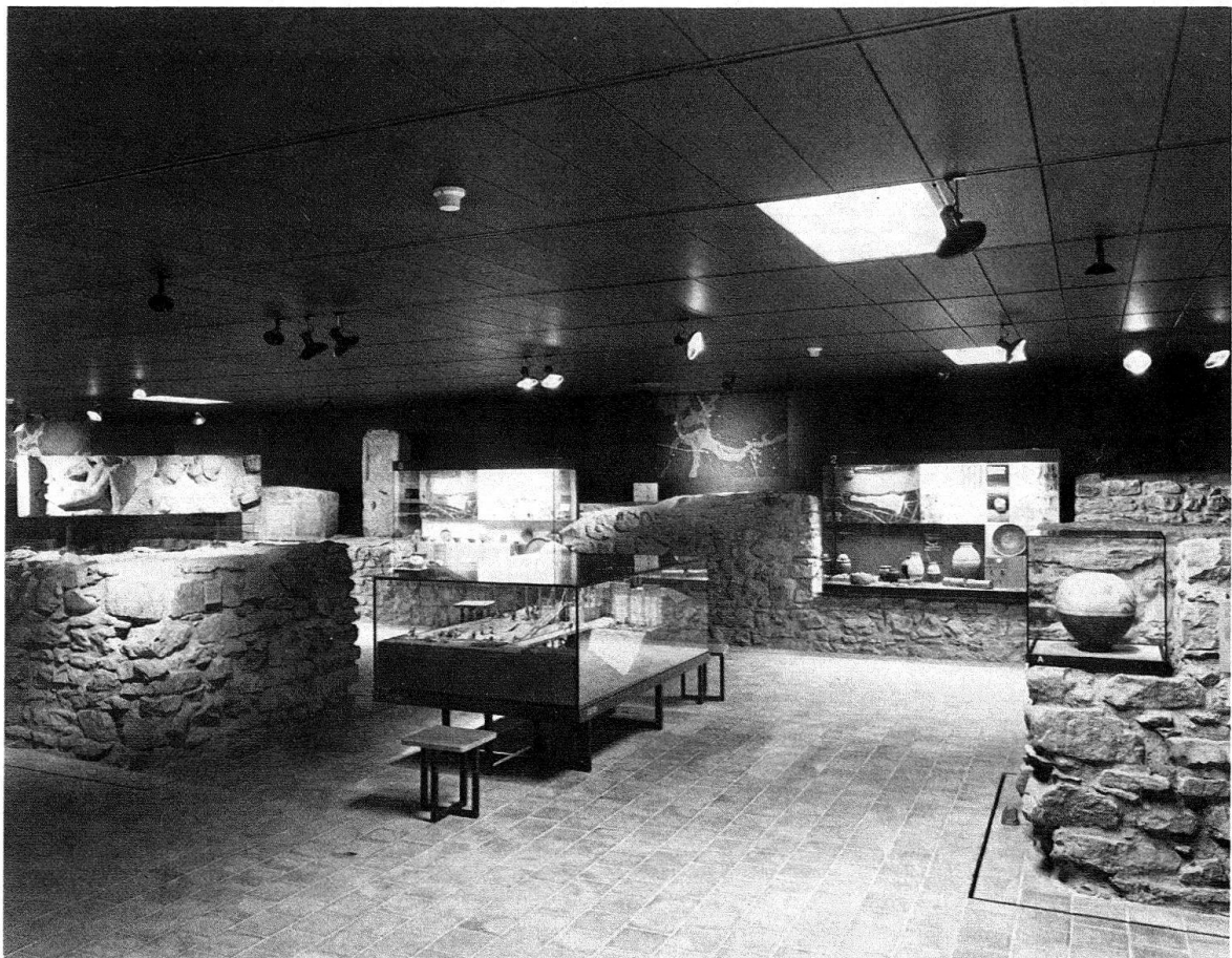
Abb. 4. Basel, Barfüsserkerche. Ältere Stadtgeschichte bis 1200, in den Fundamenten der Kirche I

Die Hauptanliegen der 1981 abgeschlossenen Wiederherstellung noch im einzelnen begründen zu wollen, hiesse nach dem Gesagten Eulen nach Athen tragen. Auch wurde aus den verschiedensten Gründen nicht alles Diskutierte verwirklicht und war der eigentliche Anlass eine Rettung im Materiellen, nämlich die teilweise Ersetzung der salzzerfressenen Langhauspfeiler. Die Ausräumung des Langhauses und die Wiederaufrichtung des Lettners gewannen entscheidende Aussagen des stets noch als Hauptstück des Museums geltenden Kirchengebäudes zurück und damit die Möglichkeit, die Sammlungsbestände auch im Sinne der einstigen Erbauer, die Besitz und strukturelle Logik immer wieder – auch bauenderweise – in Frage stellen, aufzufassen als Strandgut, Entwurzeltes, Angeschwemmtes, Aufgelesenes, als Fragment letztlich Unverständliches. Die Verlagerung grosser Sammlungsteile – «Schätze» und geschichtlich Akzentuiertes vor allem – unter den Boden, in Gewölbe, Stollen und Kavernen des Untergrunds, unterstreicht den anderen wesentlichen Überlieferungsweg des Sammlungsgutes, nämlich seine schichtweise Einbettung und fortdauernde Überlagerung durch belangvolle oder auch taube Schichten.