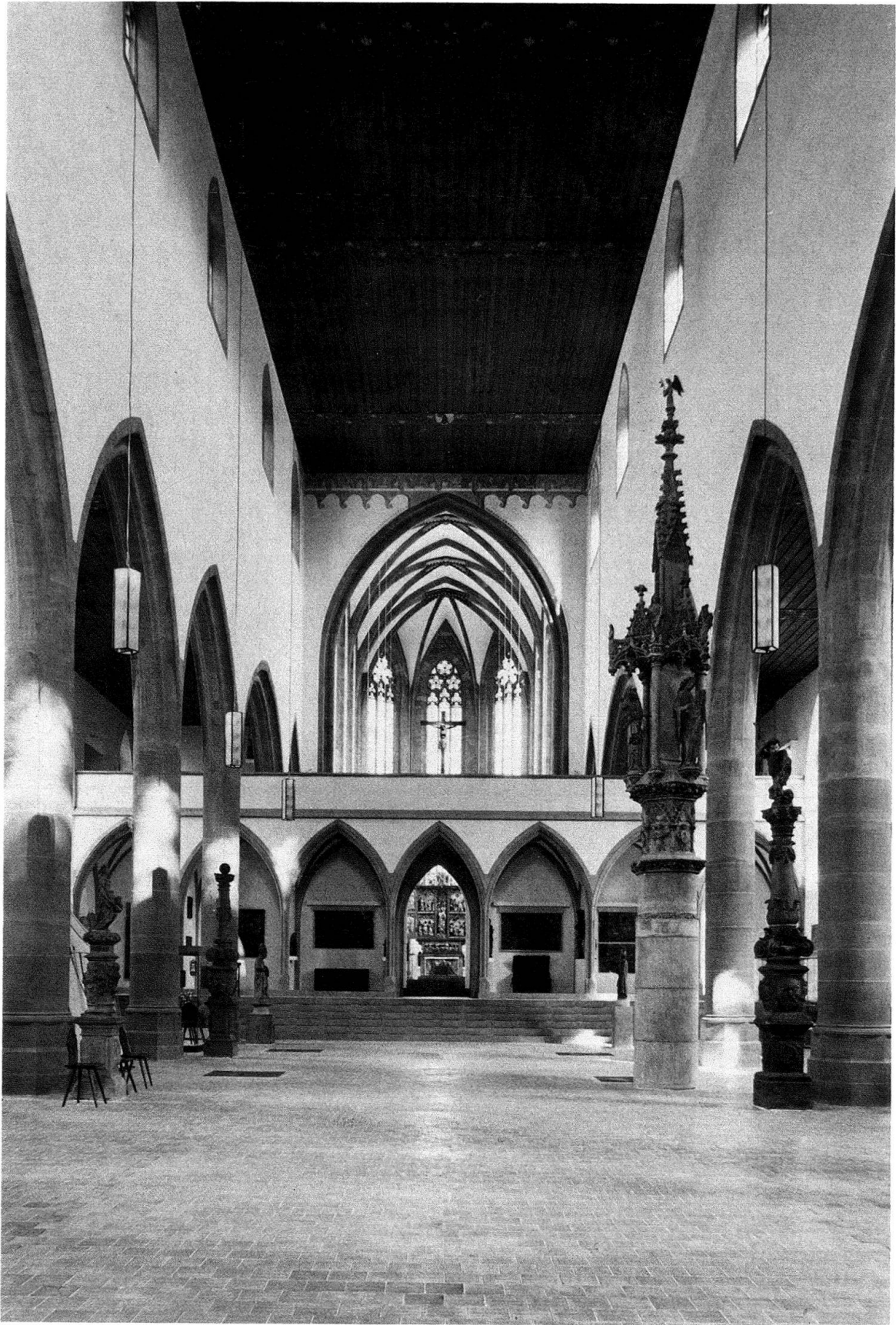
Abb. 2. Basel, Barfüsserkirche. Blick ins Mittelschiff gegen Osten mit dem rekonstruierten Lettner, 1981