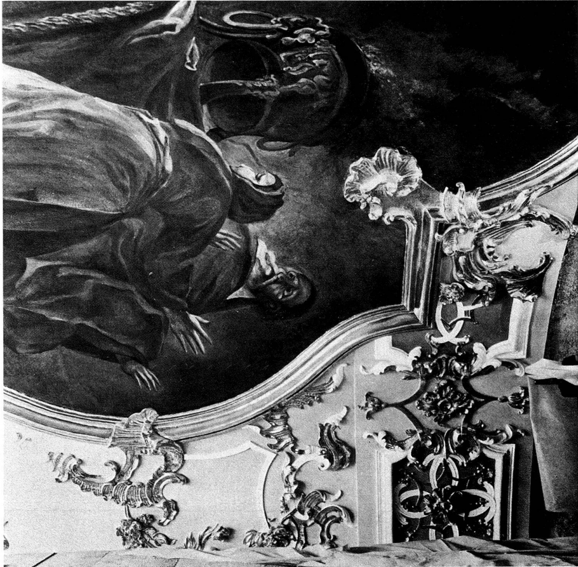
Abb. 12. Kloster Einsiedeln, Chor. Gewölbepartie in restauriertem Zustand