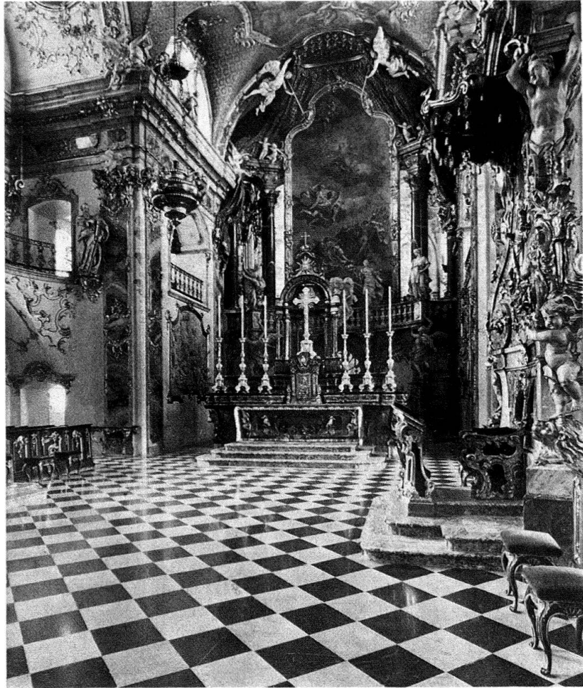
Abb. 6. Kloster Einsiedeln, Unterer Chor vor der Restaurierung