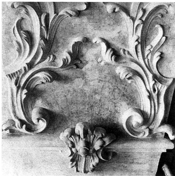
Abb. 10. Kloster Einsiedeln, Chor. Freigelegter Wandstück vor der Neufassung

Zuerst betroffen von der neuen Aufgabe war und ist das Kloster. Begreiflicherweise war niemand von der Aussicht begeistert, jahrelang mit einem Gerüst im Unteren Chor, mit allem Drum und Dran einer Restaurierung im eigenen, bewohnten Haus leben zu müssen. Denn wir wollten und konnten den Chor nicht einfach räumen und den Restauratoren überlassen, wie das normalerweise geschieht. Klosterinterne, finanzielle und nicht zuletzt seelsorgliche Gründe legten von Anfang an ein etappenweises Vorgehen nahe. Das musste die ganze Arbeit verzögern, erwies sich aber auch für die Restaurierung in manchen Punkten als positiv.