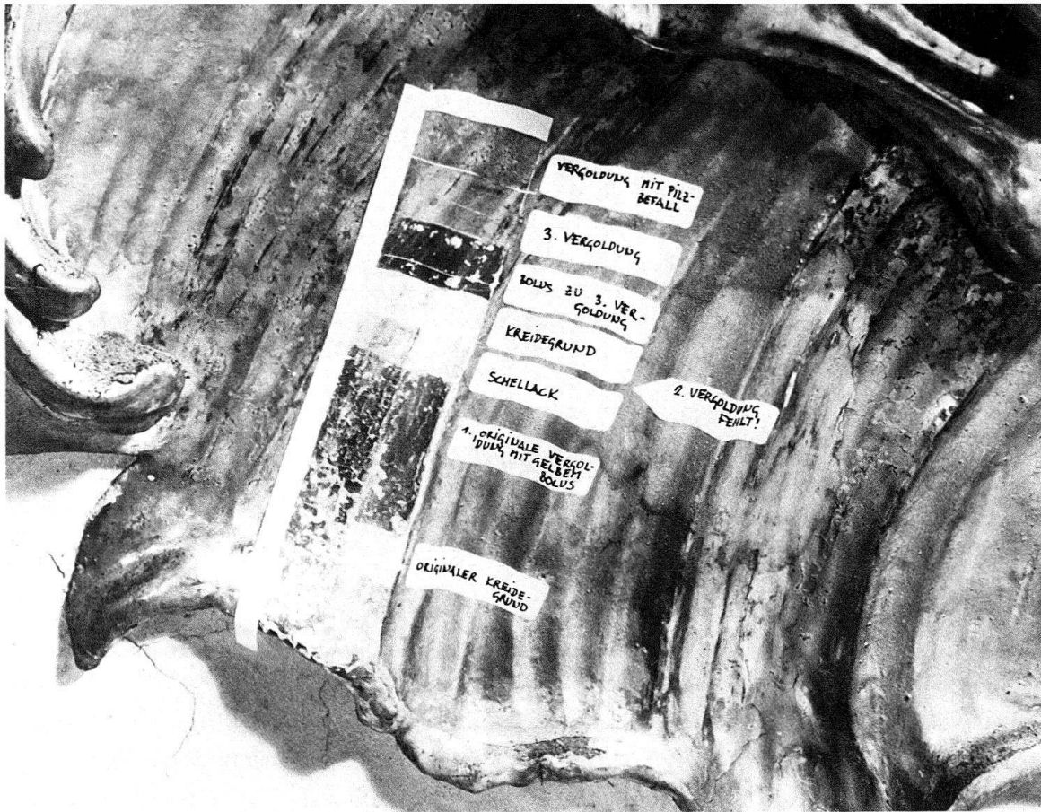
Abb. 8. Kloster Einsiedeln, Chor. Spätbarocker Stuck: schichtweise Untersuchungen der verschiedenen Fassungen

gelang, ist nicht leicht zu entscheiden. Es scheint aber doch, dass seine Fresken nicht in dem blühenden Kolorit wie die Fresken Asams gemalt waren. Im Laufe der Zeit dunkelten sie überdies nach und wirkten, besonders nach einer teilweisen Erneuerung des Kirchenschiffes in den Jahren 1836–1841, eher düster, schmutzig und russig. So ging man 1857 daran, den ganzen Unteren Chor zu überarbeiten. Diese Renovierung gab nun dem Raum ein ganz anderes Gepräge. Melchior Paul von Deschwanden (1811–1881) hatte den Auftrag bekommen, die Fresken von Kraus zu reinigen und deren matte Töne aufzuhellen 24 . In Wirklichkeit hat er sie aber in seinem eigenen Stile völlig übermalt und «mitten in die Krausschen Gestalten hier und dort Figuren seiner Erfindung hineingemalt». Auch sonst wurde nichts unberührt gelassen: die Brokatmalerei von Kraus ersetzte Deschwanden durch ein neues Muster, wobei die Rosetten mit Gold gehöht wurden. Die Decken- und Wandornamente liess er durchweg vergolden, die Gesimse, Lisenen, die Fenster- und Türrahmungen und die Säulen marmorieren und schliesslich den Schieferboden mit Juramarmor-Platten ersetzen. So kam Kuhn, der den Kraus-Chor noch gekannt hatte, zum Schluss: «Die Arbeit Deschwandens war nicht eine Restauration, sondern Übermalung und Neumalung.»