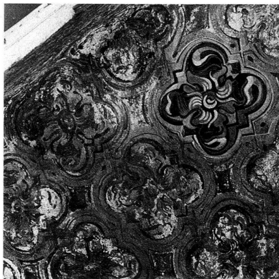
Abb. 11. Kloster Einsiedeln, Chor. Freigelegte Ornamentmalerei an den Gewölben (um 1750), teilweise retouchiert