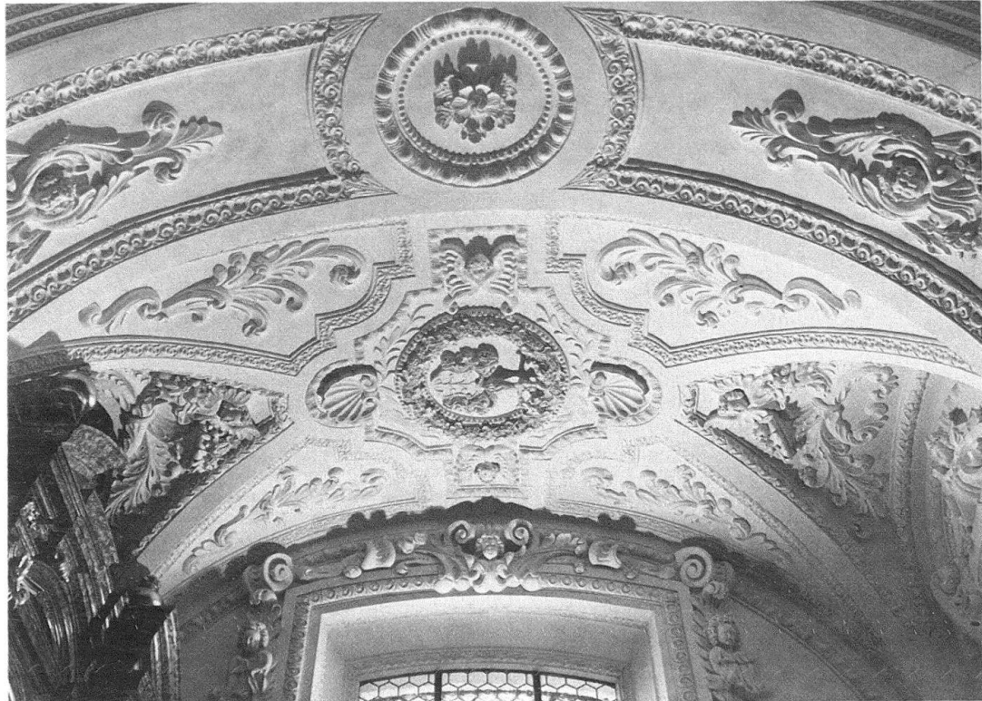
Abb. 14. Luzern, Jesuitenkirche. Zweithinterste Kapelle rechts, Bruder-Klausen-Kapelle, Deckenstück von 1672/73