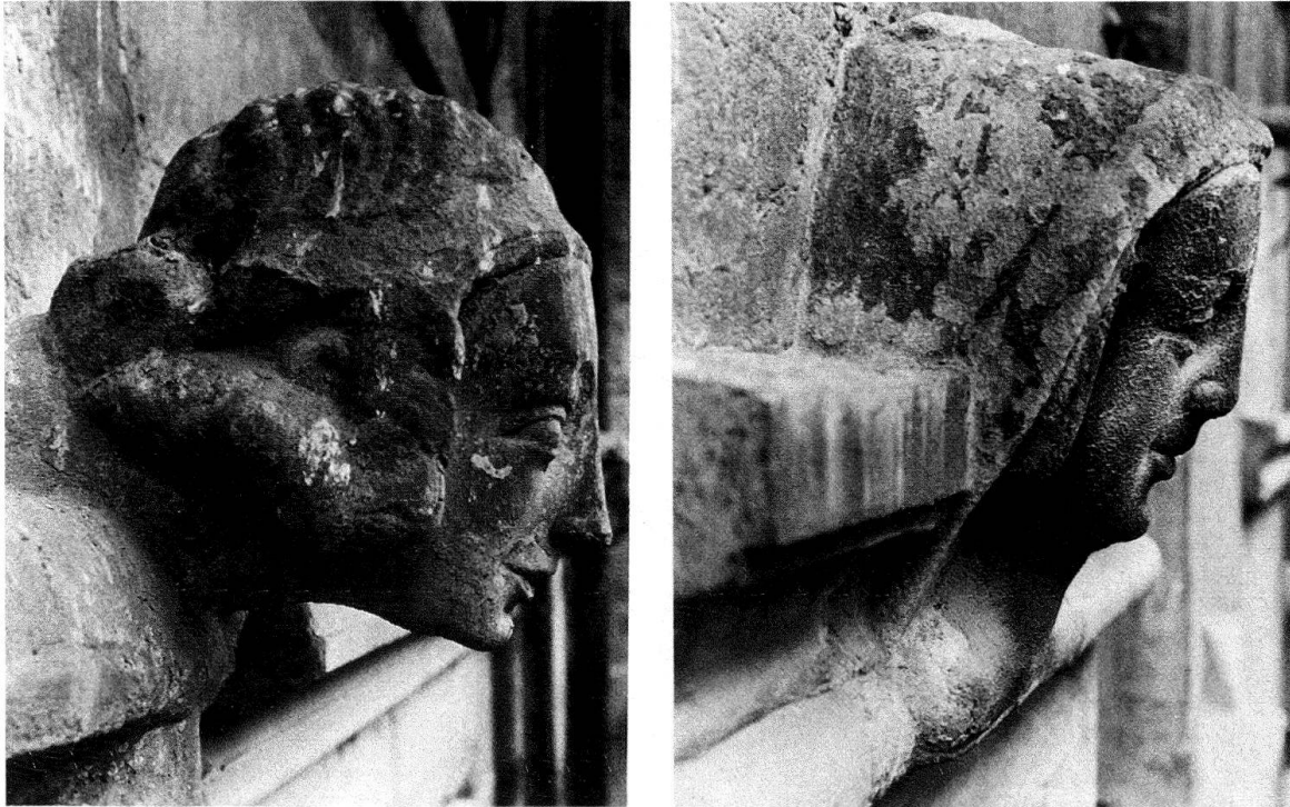
Fig. 2 et 3. Genève. Maison Tavel. Têtes sculptées (N os 3 et 9) de la façade est

Au sud, côté cour, l'escalier monumental du XVII e siècle a longtemps été seul à retenir l'attention. Il dessert tous les niveaux, du rez-de-chaussée aux combles, et abrite la porte principale de la maison. Malgré des transformations successives et parfois radicales, l'état médiéval de la façade sud reste encore parfaitement lisible. Les principaux éléments conservés sont les grandes fenêtres, autrefois à croisillon, du premier étage : elles sont posées sur un bandeau mouluré et furent plus tard reproduites au rez-de-chaussée en remplacement d'étroites ouvertures en arc brisé. Plus haut, un oculus signale peut-être la présence d'un oratoire privé. Un crénelage de grès molassique, posé à même la maçonnerie sans l'intermédiaire de mâchicoulis, couronne le tout.