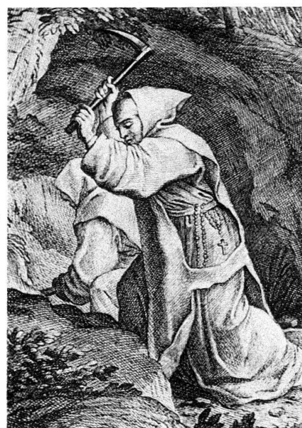
Abb. 2. Kartäuser. Ausschnitt aus einem Stich nach Le Suew, 18. Jh.