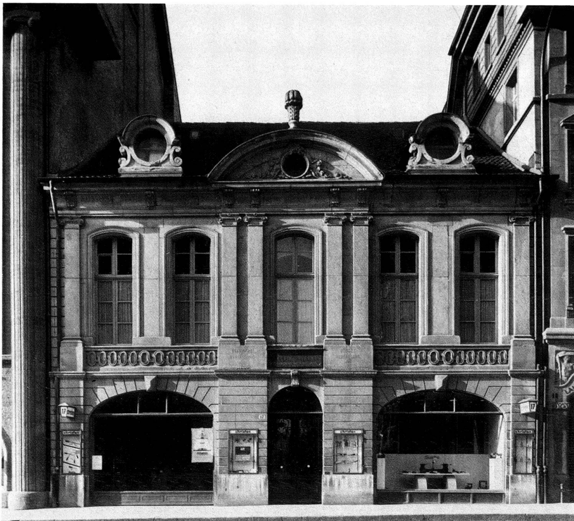
Abb. 2. Bern, Rathaus des Äusseren Standes. Die Fassade an der Zeughausgasse vor der Restaurierung