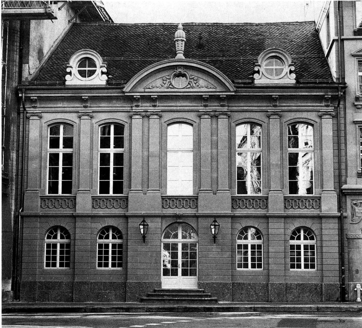
Abb. 3. Bern, Rathaus des Äusseren Standes. Die Fassade an der Zeughausgasse nach der Restaurierung

gang fast täglich auf der Baustelle. Seine parallel dazu unternommenen Quellenforschungen im Staatsarchiv und auf der Bürgerbibliothek Bern brachten viele neue Erkenntnisse, die in einer Publikation 2 und in einem «Schweizerischen Kunstführer» ihren Niederschlag gefunden haben.