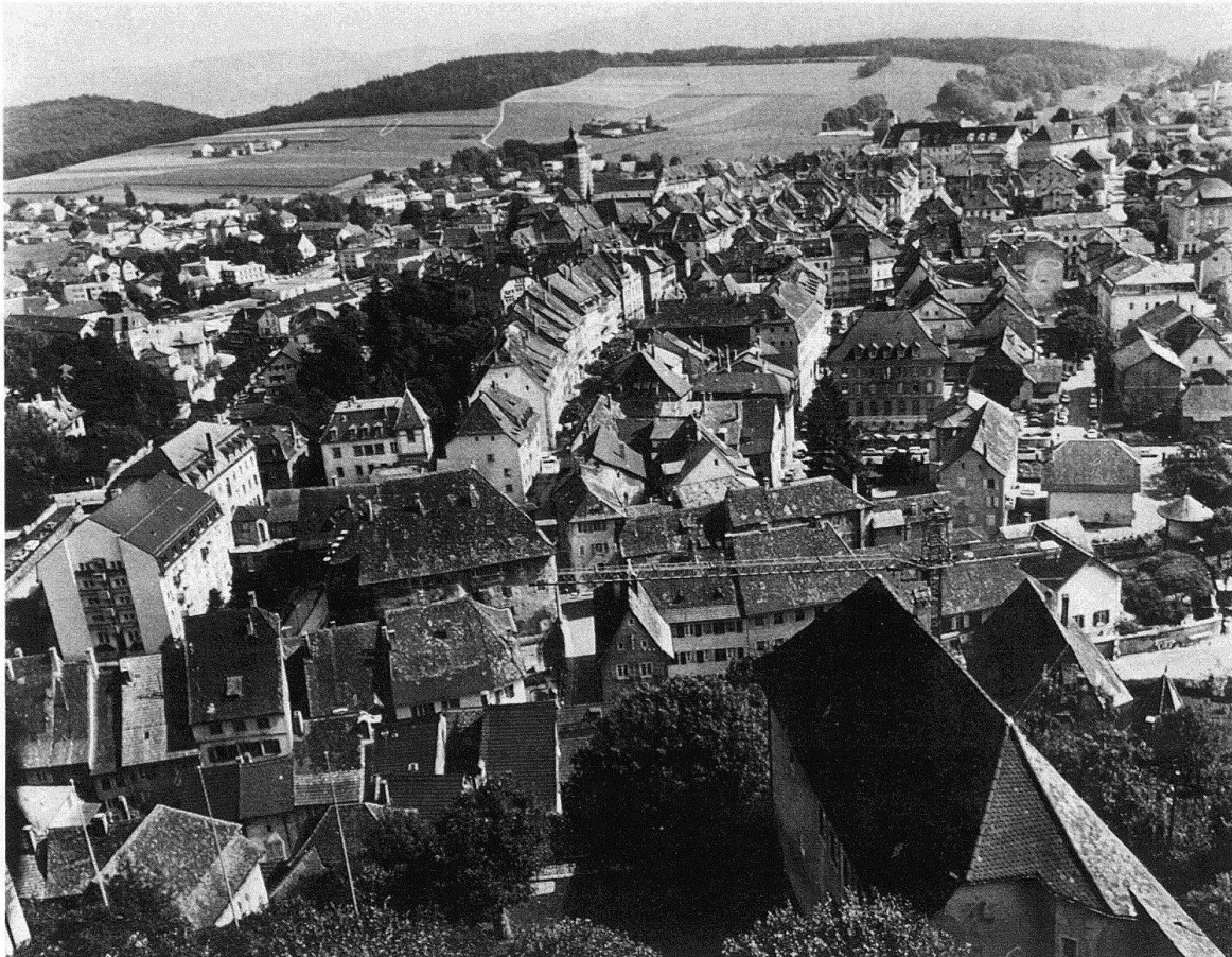
Porrentruy. Vue générale de la ville vers le sud