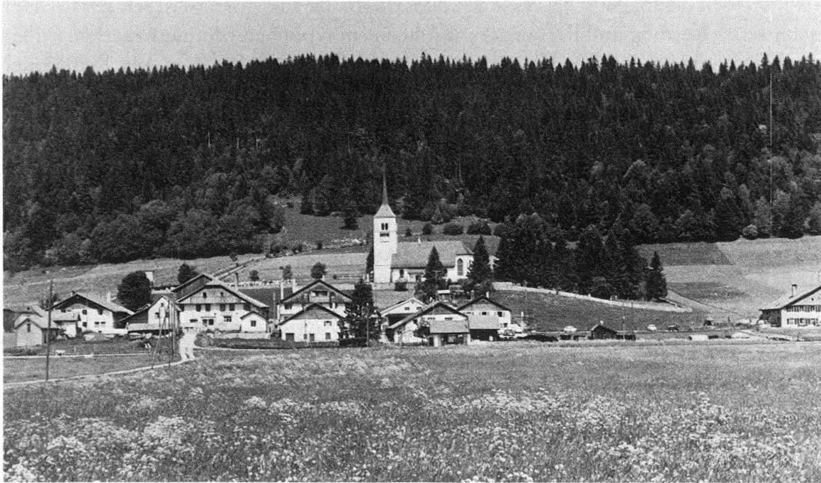
La Sagne-Eglise. Vue générale

COLOMBIER a un château en partie construit sur une très grande villa romaine. Les seigneurs du lieu firent bâtir un donjon, englobé dans un corps de logis à la fin du XV e siècle et agrandi au milieu du XVI e siècle. Une tour d'entrée de 1543, une galerie dès 1618, des communs et la porte des Allées donnent de l'ampleur à l'édifice, acquis en 1564 seulement par le comte de Neuchâtel. Tout près, le temple néo-classique de 1828 a remplacé une église romane.