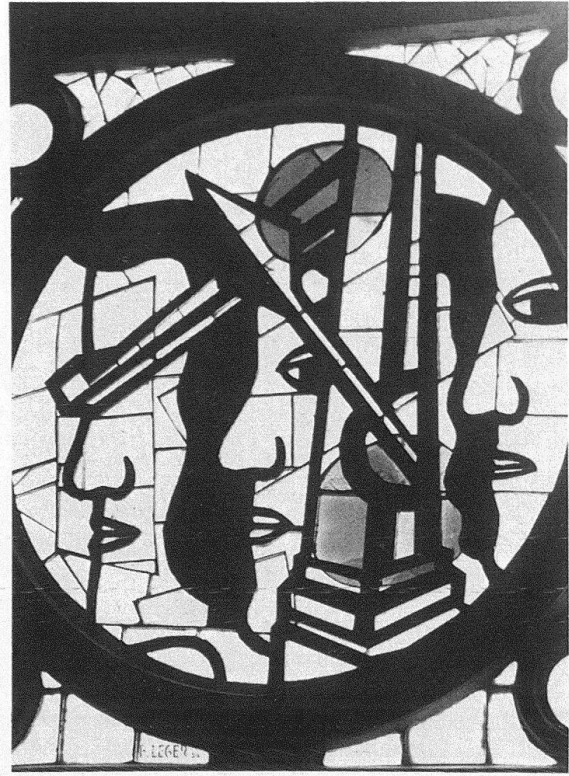
Delémont. Château de Dormont. Poêle toux, 1722 (détail). – Courfaivre. Kath. Pfarrkirche St-Germain-d'Auxerre. Glasmalerei von Fernand Léger, 1954

Départ: 09 h 00; place de la Gare, Delémont Participants: env. 40 personnes Repas: 12 h 00 à 13 h 30; Restaurant du Lion d'Or, Cornol Route: Delémont, Les Rangiers, St-Ursanne, Cornol, Courgenay, Porrentruy, Alle, Miécourt, Asuel, Les Rangiers, Delémont (17 h 45)