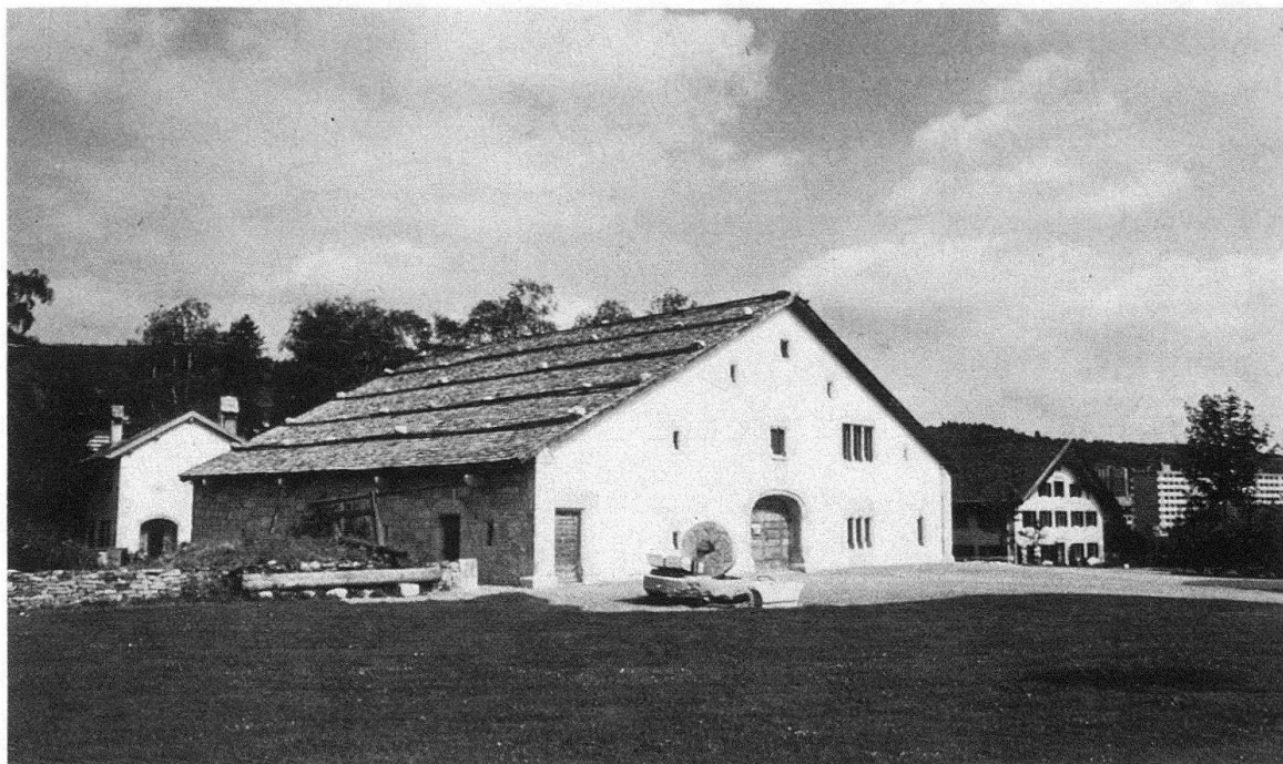
La Chaux-de-Fonds. Musée paysan aux Eplâtures, 1612