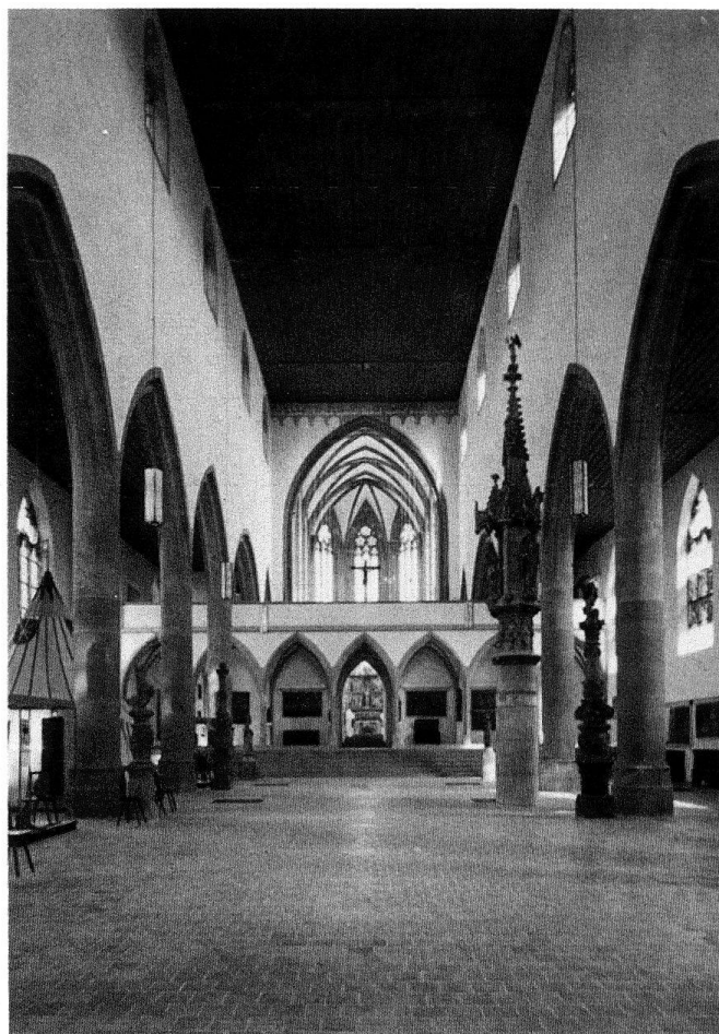
Abb. 4. Basel, ehem. Barfüsserkirche (erste Hälfte 14. Jahrhundert), heute Historisches Museum Basel

seums-, Ausstellungs- und Versammlungsräume beschränkt. Allein schon aus diesen Gründen wird man gut tun, den Sakralbauten möglichst lang ihre angestammte Nutzung zu erhalten suchen, will man nicht Gefahr laufen, erhaltenswerte Kirchenbauten infolge fehlender Nutzung abbrechen zu müssen. Auch hierfür gibt es zahlreiche Beispiele. Stellvertretend für viele sei hier auf die abgebrochene englische Kirche in Pontresina hingewiesen: ein Verlust, der um so schwerer wiegt, als es sich dabei um ein künstlerisch bemerkenswertes Zeugnis englisch-schweizerischer Neugotik handelte.