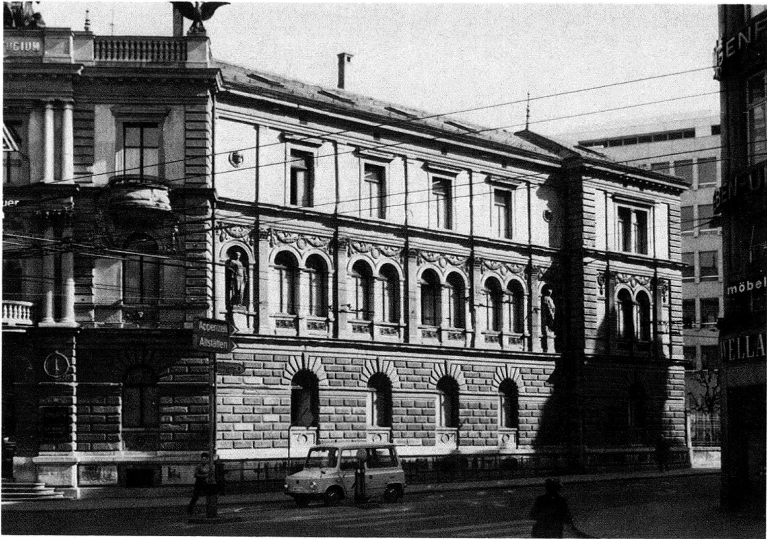
Abb. 1. St.Gallen, «Helvetia Feuer», Versicherungsgebäude erbaut von Christian Johann Kunkler, 1876–1878, abgebrochen

handene Bereitschaft, alte Bausubstanz weiterzuverwenden, um- oder neuzunutzen, massgeblich für die zahlreichen Abbrüche von erhaltenswerten Bau- und Kulturdenkmälern verantwortlich. Der seinerzeit vieldiskutierte Abbruch des Helvetia-Versicherungsgebäudes in St. Gallen ist nur eines der vielen Beispiele hierfür. Auch wenn immer wieder die Baufähigkeit, grundrissliche Unzweckmässigkeiten, mangelhafte sanitärische Installationen und andere Gründe vorgeschoben werden, so sind eben letztlich doch die in Aussicht genommene Mehrnutzung und Gewinnoptimierung die wahren Beweggründe, denen Altbauten zum Opfer fallen. Die bereits weit fortgeschrittene und noch anhaltende Zerstörung der einst einheitlichen 19.-Jahrhundert-Wohnquartiere ist wohl der sichtbarste Ausdruck dieser Verhaltensweise. Von einem Nutzungsnotstand kann hier nämlich kaum gesprochen werden. Dieser trifft vielmehr für Bauten der Technik und der Industrie zu, als für die im allgemeinen nutzungsneutraleren Wohnbauten. Immerhin gibt es auch hier Ausnahmen. Die noch zu schreibende «Geschichte der Abbrüche» kennt vor allem aus dem Gebiet des 19.-Jahrhundert-Villenbaus einige bedauernde Beispiele, denen sich als jüngstes Glied – wenn nicht alles täuscht – die wegen fehlenden Nutzungsmöglichkeiten leerstehende und vom Abbruch bedrohte romantische Schlossvilla Neuhabsburg (1868–1871) in Meggen anreicht.