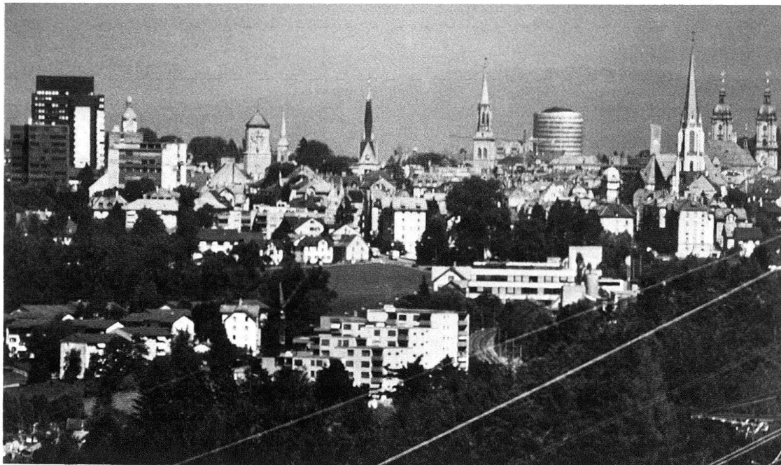
St. Gallen von Westen 1982 – die alten und die neuen Türme...