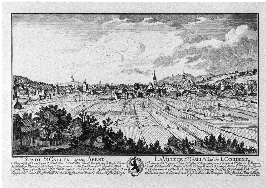
St. Gallen von Westen nach David Herrliberger, 1761