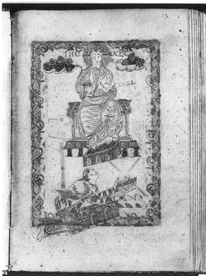
Abb. 3. Einsiedeln, Stiftsbibliothek, Codex 17, S. 23: Dedicatio

Christus ist nicht allein. Ein Mönch – an seiner Tonsur als solcher deutlich erkennbar – reicht Christus das vollendete Buch dar. Es handelt sich also um das Widmungsbild, die Dedicatio: Der Mönch – der Schreiber oder der Abt als Auftraggeber oder eben der hl. Ulrich – weiht das Buch dem Herrn; da die Begegnung zwischen den beiden nur im Gebet erfolgen kann, erscheint der Mönch in Proskynesis, in der Erniedrigung vor Christus – in westlicher Milderung der unbequemen Haltung mit Hilfe des Betschemels. Es überrascht die eigenständige Art, dieses an sich geläufige Bildthema zu gestalten – ein Grundzug der sanktgallischen Buchkunst 17 .