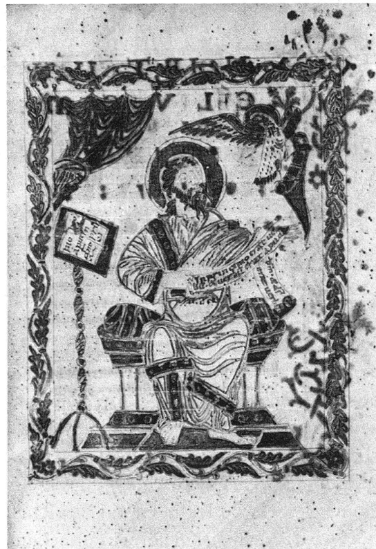
Abb. 4-7. Einsiedeln, Stiftsbibliothek, Codex 17, S. 24 (Evangelist Matthäus), S. 25 (Incipit des Matthäus-Evangeliums), S. 185 (Evangelist Lukas), S. 285 (Evangelist Johannes)