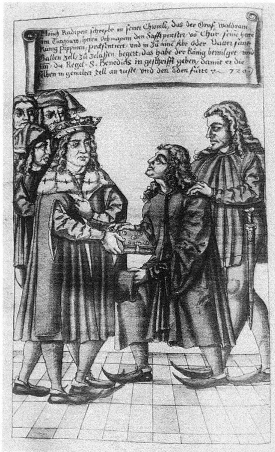
Abb. 7. Begegnung des hl. Otmar vor König Pippin. Lavierte Federzeichnung 1549 von Caspar Hagenbuch in der Vadian-Chronik, S. 46 (Stadtarchiv [Vadiana], St. Gallen)