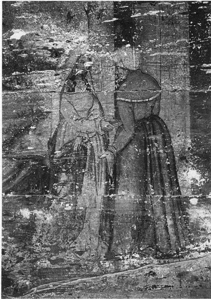
Abb. 6. St. Gallen, Spisergasse 23. Heimsuchung, 1553 (Ausschnitt). Zustand vor der Restaurierung 1982

Unser Künstler war gewiss kein genialer Meister. Zu offensichtlich sind die Ungelenkigkeiten in der Gestik und die Disproportionen im Körperbau; aber der souveräne Bildaufbau, die gekonnte Raumillusion und die Körperhaftigkeit der Figuren weisen doch auf einen Mann mit einigem Kunstverstand hin. Die Liebe zum zeichnerischen Detail mit fast aufdringlichen Umfahrgungslinien und nervösen Gewandfalten lassen ein Talent vermuten, das auch mit der Feder umzugehen wusste.