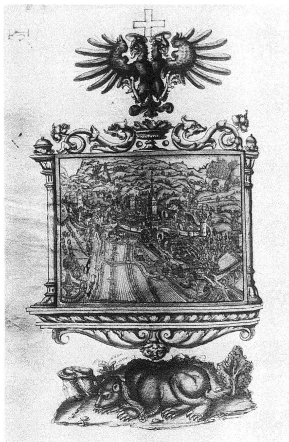
Abb. 8. Westansicht der Stadt St. Gallen, nach einem Holzschnitt von Heinrich Vogtherr. Lavierte Federzeichnung 1549 von Caspar Hagenbuch in der Vadian-Chronik, S. 431 (Stadtarchiv [Vadiana], St. Gallen)

128 Wappen sanktgallischer Geschlechter gemalt sind, u. a. auch diejenigen der Studer, Mangolt und Mötteli in fast identischer Ausführung wie an der Hinterlauben.