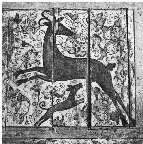
Abb. 2 und 3. St. Gallen, Gallusplatz 37, Haus «Zum Ölblatt». Ausschnitt aus einem die ganze Wand deckenden Blumendekor. – Von Hund aufgescheuchte Gemse aufsenkrecht gezimmerter Bohlenwand. 3. Viertel 16. Jh. Zustand vor der Restaurierung 1980