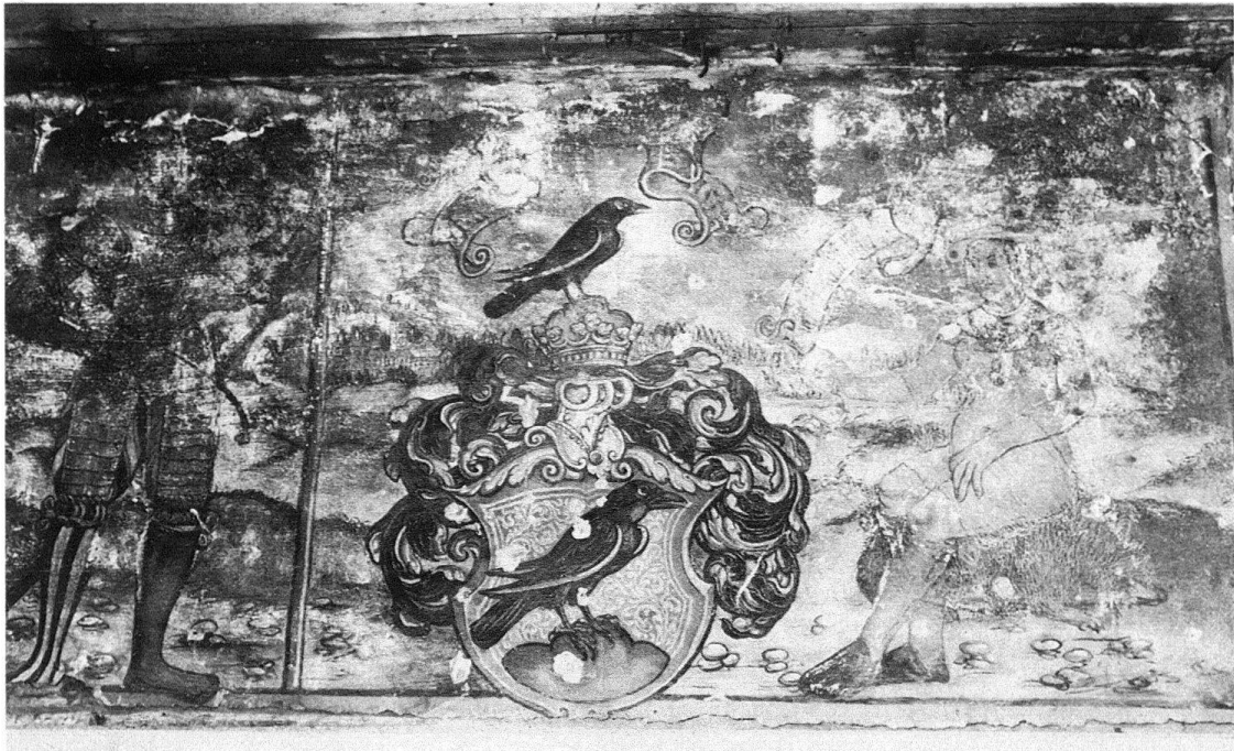
Abb. 1. St. Gallen, Hinterlauben 13. Volles Wappenschild Mötteli von Rappenstein, bewacht von Krieger und Dame auf Igel. Secco-Malerei auf Putz, 1555 oder 1556. Zustand vor der Restaurierung 1979