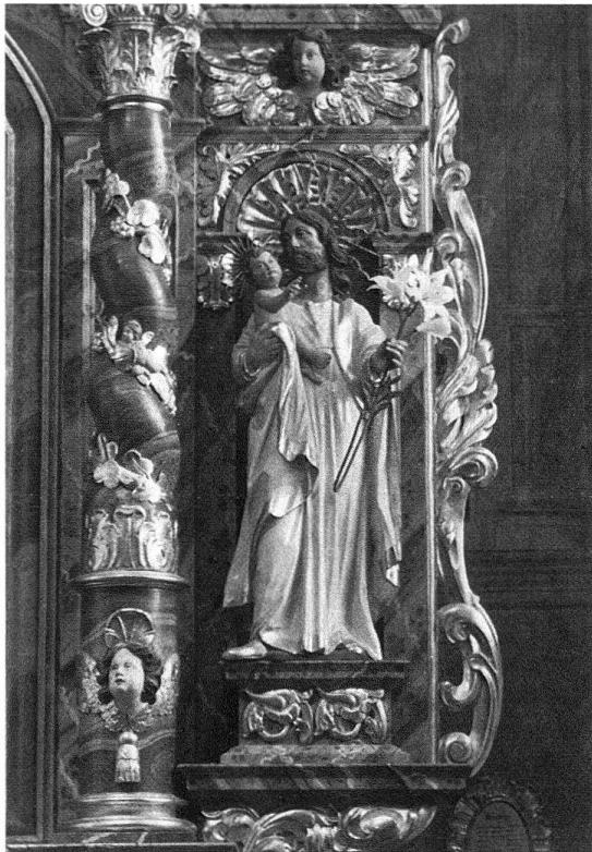
Abb. 3. Vild, hl. Joseph, 1685. Detail des Hochaltars