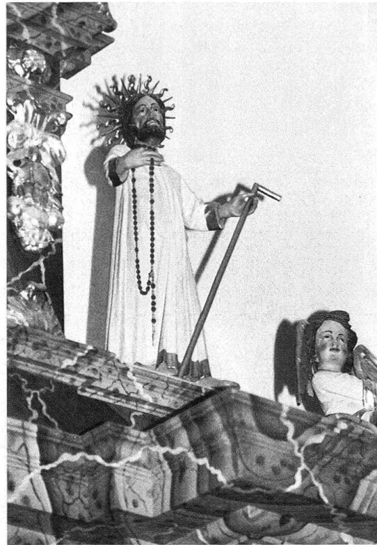
Abb. 4. Vild, Bruder Klaus, 1685. Detail des Hochaltars

schen Orte bringen zu wollen 15 . Gleichzeitig wurde dem Landvogt von Luzern aufgetragen, auch die übrigen katholischen Orte über die Angelegenheit zu informieren. Erst im Juli 1743 wurde der Landvogt auf der Tagsatzung der katholischen Orte angewiesen, einen Kostenvoranschlag für die Fassung des Altars vorzubereiten 16 . In einem am 7. August 1743 an Luzern gerichteten Schreiben nimmt der Sarganser Landvogt Franz Josef Müller (1743–45), ein Obwaldner, Bezug auf den Beschluss der katholischen Orte in Frauenfeld vom 30. Juli. Darnach war ein Akkord in der Höhe von 72 Florin mit einem Rapperswiler Maler zur Fassung des schon anno 1685 errichteten, «biss dato aber ohngefasst stehenden Choraltars» der Unbefleckten Empfängnis geschlossen worden 17 . Luzern genehmigte den Akkord am 16. Dezember 1643 18 , die katholischen Orte taten ein Gleiches auf ihrer Konferenz im Juli 1744 19 .