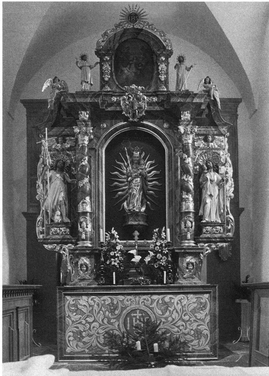
Abb. 2. Der Hochaltar der Kapelle Vild bei Sargans, der Unbefleckten Empfängnis Mariens geweiht, 1685. 1979–81 wiederhergestellte Fassung von 1744