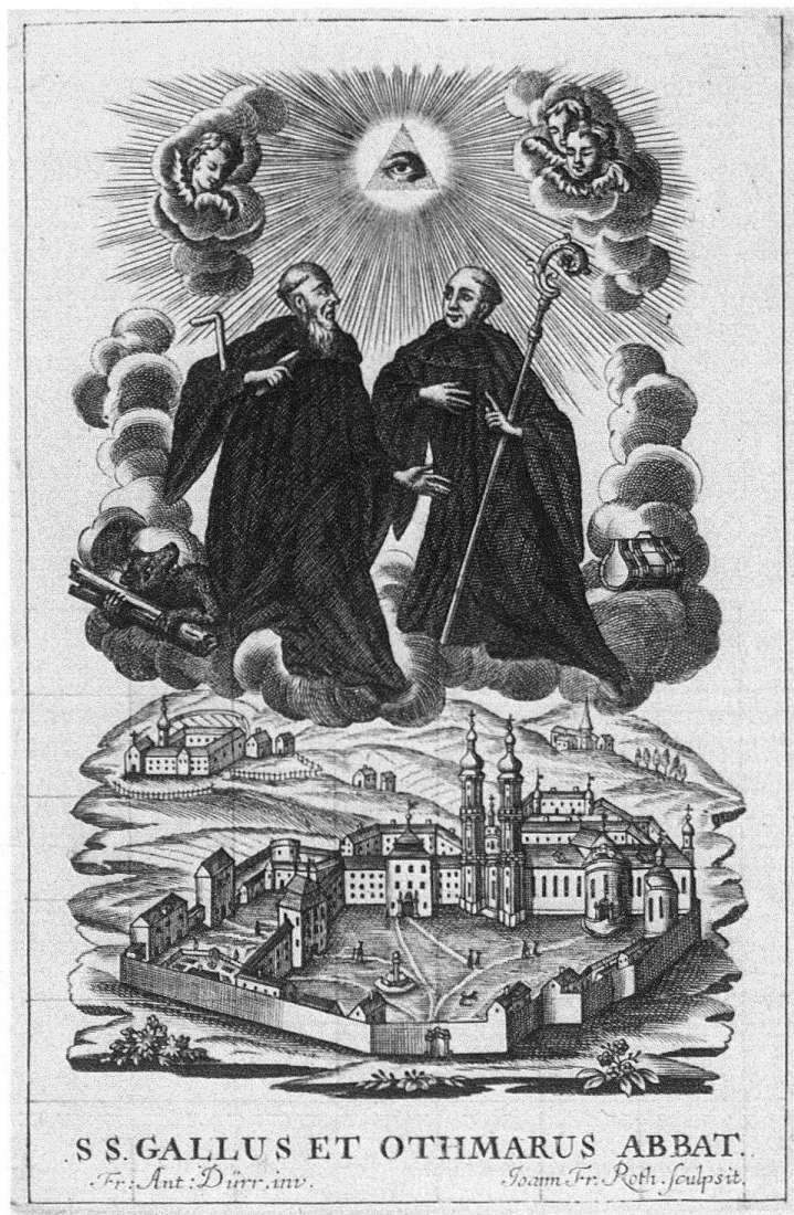
Abb. 3. Die heiligen Gallus und Otmar als Patrone des Klosters St. Gallen. Kupferstich von Roth und Dirr in Veränderung der gleichartigen Darstellung auf dem Handwerkerbrief (vgl. Abb. 2)

was am 11. August 1764 den Unwillen des Rates der Stadtrepublik St. Gallen erregt hatte 12 .