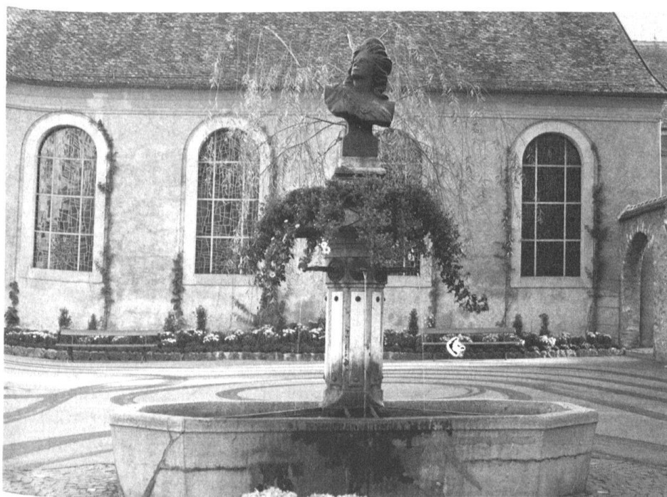
1 Gustave Courbet, Helvetia, plâtre, hauteur 100 cm (La Tour-de-Peilz, Maison de Commune).