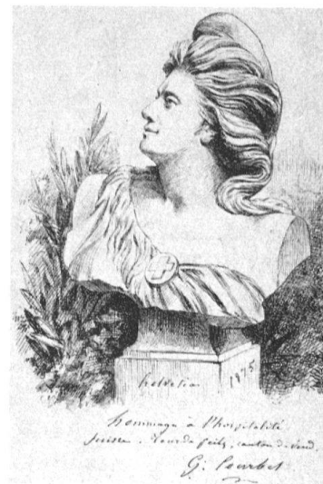
6 Gustave Courbet, Helvetia, lithographie 345×253 cm (Musée cantonal des beaux-arts, Lausanne).