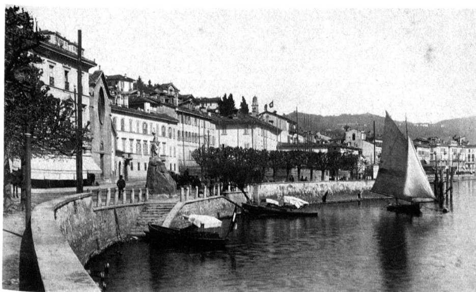
2 Lugano, la riva in prossimità della chiesa di Sta. Maria degli Angeli, con il Guglielmo Tell davanti all'Albergo del Parco. Situazione attorno al 1896.

Su Gazzetta Ticinese del 6 settembre 1856 si legge: «Lugano da alcuni giorni fu arricchita di un nuovo monumento: la statua di Guglielmo Tell, opera del rinomato scultore ticinese Vincenzo Vela.» L'indipendenza d'Italia era stata causa di tensioni continue fra Ticino ed Austria e le gravi disposizioni prese nel 1853 dal Governo di quel paese, dirette a impoverire e smembrare il Cantone, non erano allora certo ancora state dimenticate. Tuttavia Vela non intese, a mio parere, ricordare quei fatti attraverso un'opera storica dal contenuto simbolico; anche se il suo Tell appare ritratto nel dinamismo che seguì l'azione e con la passione espressa nel gesto, ciò che conta realmente è l'esaltazione di quella figura ideale in cui si personifica il sentimento nazionale svizzero dei Ticinesi, uscito rafforzato dal Blocco austriaco: «Il popolo ticinese potè riconoscere, di fronte alla prontezza dei soccorsi federali, che esso non si trova meno vicino alla patria degli altri suoi membri, malgrado la sua separazione geografica e la sua particolarità linguistica.» 5 Se nell'esecuzione del Tell Vela scelse di ridurre ad un minimo l'apparato descrittivo della leggenda – Gualtierino è assente, manca la mela, le vesti sono semplicissime – fu per dare rilievo unicamente al mito del personaggio, capace di rappresentare ora anche le convinzioni ideologiche dei Ticinesi.