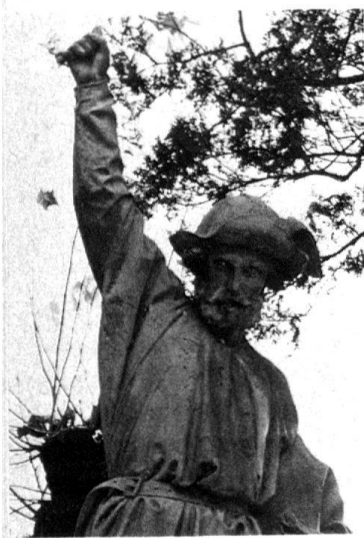
1 Lugano, Monumento a Guglielmo Tell di Vincenzo Vela, dettaglio.

Come non rimase estraneo alle questioni d'indipendenza che l'Italia della metà dell'Ottocento era chiamata a risolvere, così Vela fu sensibile all'affermarsi del sentimento nazionale svizzero dei Ticinesi dopo il 1848. Partecipe dell'arte romantica e nella convinzione che le ragioni d'indipendenza della nazione risiedono nella propria storia, lo scultore diede forma al Guglielmo Tell. Il monumento, collocato dapprima nei pressi della chiesa di Sta. Maria degli Angeli e in seguito sulla piazza antistante il Kursaal, non ebbe molta fortuna critica. Oltre che a Lugano, in Ticino troviamo rappresentazioni del Tell anche a Minusio e a Loco. La figura dell'eroe comparve anche sulla scena teatrale e ricorre in numerosi canti e sonetti popolari.