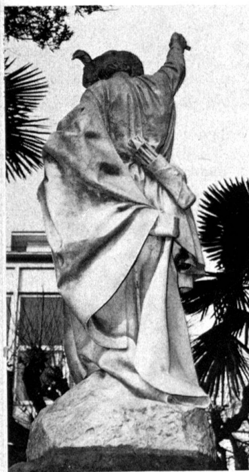
3 Lugano, la statua vista di dietro.

Nel manto invece, che con un movimento di luce ed ombra dal braccio sinistro ricade in pieghe morbide sullo zoccolo dopo essere stato trattenuto dal tenere della balestra, Vela regredisce verso un accademismo – forse alla ricerca, comunque, di una grandezza classica del suo Tell –, che la critica per lo più gli ha negato.