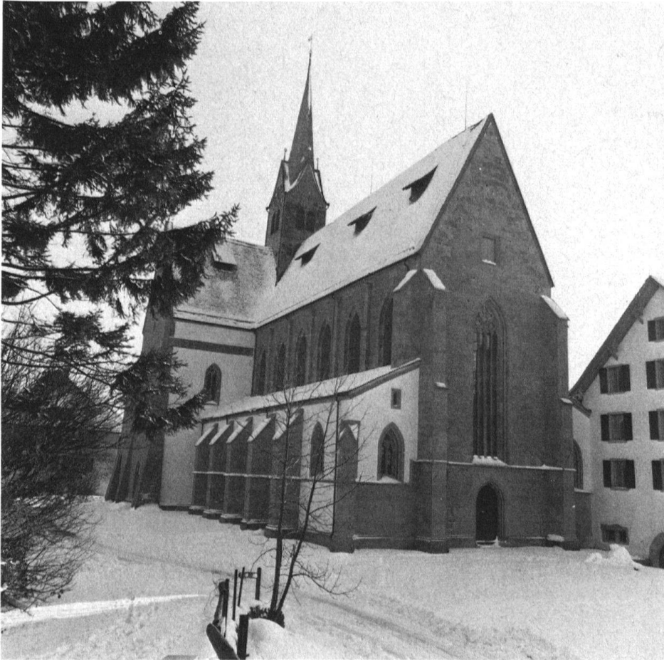
1 Kappel, Klosterkirche, Ansicht von Nordwesten.

ebenfalls aus der Bauperiode des 13. Jahrhunderts stammen. Zumeist ist hier allerdings die geschilderte feine Zahnflächung anzutreffen, die in diesem Fall von einer Umarbeitung im Zusammenhang mit dem Hochschiff-Ausbau herrühren dürfte. Dabei wäre es interessant, der Frage nachzugehen, inwieweit und ob die Umarbeitung eines bestehenden älteren Bauglieds einen Steinmetz berechtigte, auf dem durch ihn veränderten Stück sein Zeichen anzubringen. Es treten nämlich auf den fein zahngelächten Pfeilern und Arkaden dieselben Steinmetzzeichen auf.