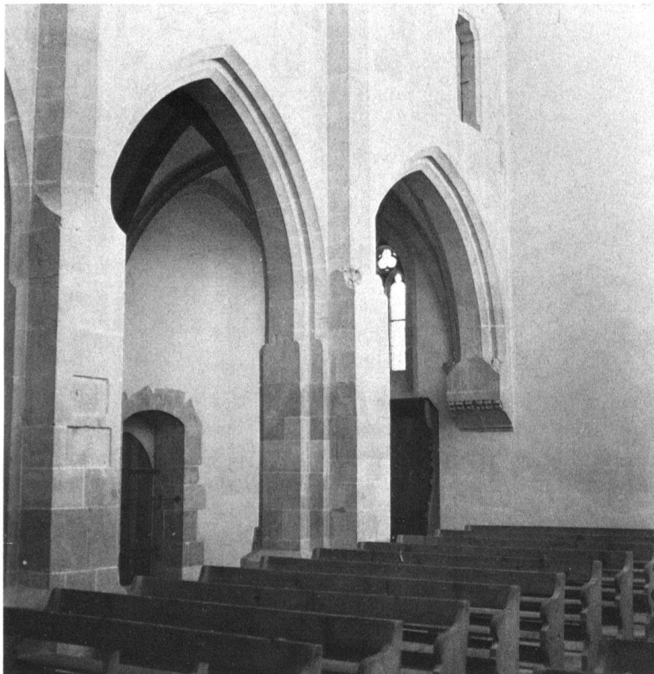
2 Kappel, Klosterkirche, Mittelschiffpfeiler gegen Südwesten.

zu den Wanddiensten wären dann Umarbeitungen der bestehenden, aber zur Zeit der Aufführung der hochgotischen Hochwände des Mittelschiffes unmodern gewordenen schweren Rechteckformen im Sinne einer Verfeinerung und optischen Erleichterung. Technische Einwände gegen die Wahrscheinlichkeit eines solchen Verfahrens können am Bau nicht gefunden werden. Hingegen ist als Indiz dafür zu werten, dass der Eckdienst des Vierungspfeilers an der Langhauswand rechtwinklig und kantig emporfährt, und dass dann oben beim Ansatz der Rippengewölbe ein etwas unbeholfener Übergang gesucht werden musste 6 . Diese beiden Pfeiler waren, im Gegensatz zu den Langhauswänden, bereits in ganzer Höhe aufgeführt, als man die Wölbungspläne für das Schiff abänderte. Den ursprünglich geplanten Gewölbeverlauf zeigen die strafferen Spitzbogen der Vierung mit nichtgefastem Rechteckprofil.