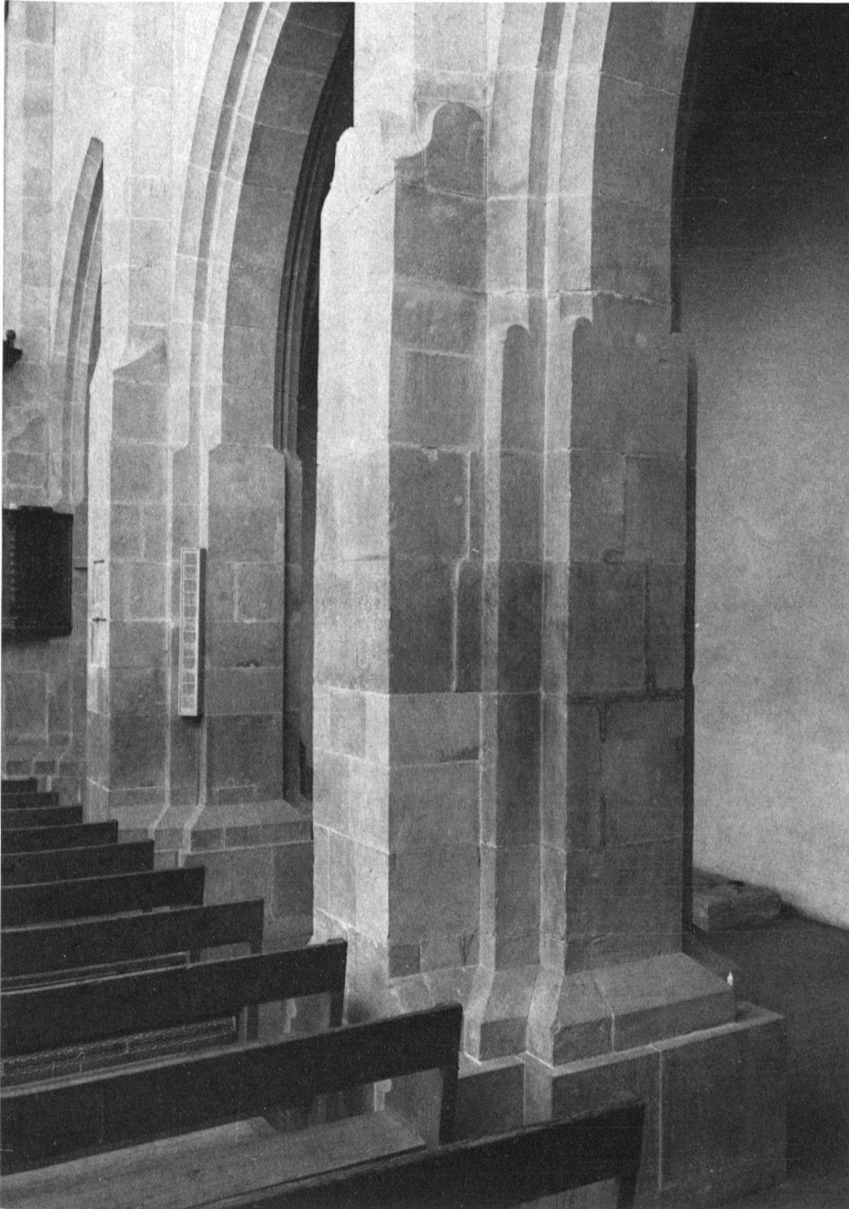
3 Kappel, Klosterkirche, Mittelschiffpfeiler gegen Südosten.

Quaderwerk im Sockelbereich den kleinteiligen Charakter der Ostteile hat, während darüber die Mauerstruktur mit derjenigen des Obergadens übereinstimmt.