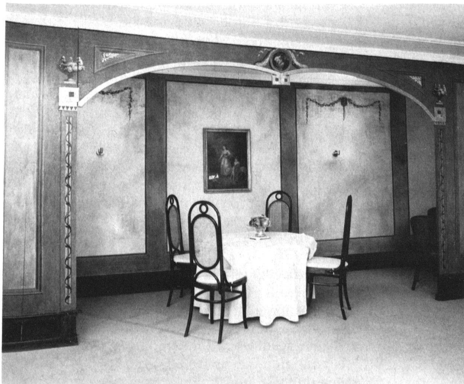
1 Zug, Haus Fischmarkt 11. Dritter Stock, Nordzimmer. Ansicht des Alkovens.

Das viergeschossige Haus Fischmarkt 11 datiert aus dem 16. Jahrhundert und steht in der Zuger Altstadt, in der Achse der in den Fischmarkt einmündenden Untergasse. Anlässlich einer Bauuntersuchung im April 1978 wurden unter anderem im Nordzimmer des dritten Obergeschosses figürliche und dekorative Malereien entdeckt. Diese lagen unter Tapeten bzw. Kunstharz- und Ölfarbanstrichen.