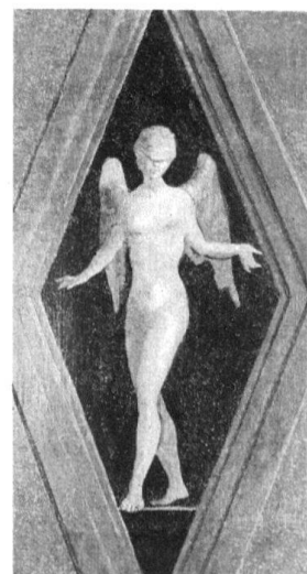
8 Zug, Haus Fischmarkt 11. Dritter Stock, Nordzimmer. Allegorie «Bedächtigkeit» am Rundkasten in der Nordwestecke.