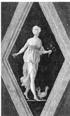
Titelbild: Zug, Haus Fischmarkt. Dritter Stock, Nordzimmer. Allegorie «Der Fleiss» am Rundkasten in der Nordostecke.

Interessant sind hier die Erläuterungen zu den Attributen. Die Biene verkörpert den Fleiss, weil sie sich die Mühe nimmt, selbst aus relativ trockenen Kräutern wie Thymian Saft zu gewinnen, was dafür einen würzigeren Honig verspricht. Der Mandelzweig bedeutet Hastigkeit, weil er im Jahreslauf der Natur als erster blüht, der Maulbeerzweig hingegen bedeutet Langsamkeit, weil er als letzter blüht: Beide zusammen ergeben als guten Mittelweg den Fleiss, weshalb die beiden Zweige auch in einer Hand vereinigt sind. Der Hahn steht für den Fleiss, weil er von frühmorgens an durch sein unermüdliches Scharren und Stöbern das gute Körnchen auf dem Erdboden zu suchen hat. Diese Begründungen konnten für den Maler der Zuger Allegorie nicht mehr verpflichtend sein. Offenbar genügte es ihm, Fi-