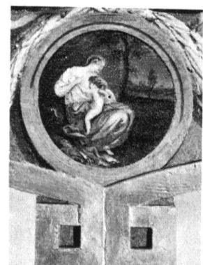
4 Zug, Haus Fischmarkt 11. Dritter Stock, Nordzimmer. Mittelpartie der Alkovenfront mit «Venus stillt Amor» im Rundmedaillon.