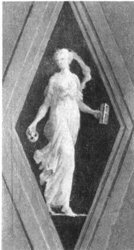
6 Zug, Haus Fischmarkt 11. Dritter Stock, Nordzimmer. Allegorie «Redlichkeit» am Rundkasten in der Südwestecke.