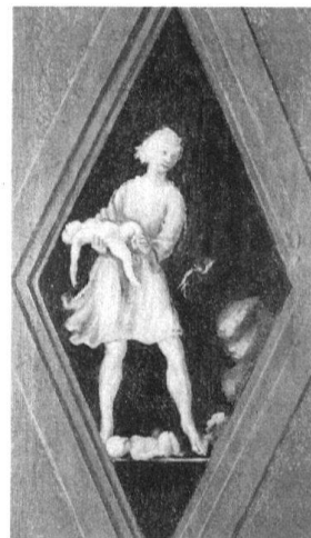
7 Zug, Haus Fischmarkt 11. Dritter Stock, Nordzimmer. Allegorie «Dämpfung böser Gedanken» am Rundkasten in der Südost-ecke.

Zu dieser Personifikation findet sich in den verschiedenen «Iconologia»-Editionen keine unmittelbare Vorlage. Das Motiv des geflügelten Frauenaktes mit verbundenen Augen erscheint zwar in der Pariser Ausgabe von 1644, jedoch unter dem Titel «Cupidité» (Begierde). Ein Zusammenhang zwischen Begierde und Bedächtigkeit ist allerdings kaum herzustellen, höchstens wenn man sie als Gegensatzpaar betrachtet. Die Frage nach der oder den möglichen Vorlagen für diese Darstellung bleibt vorläufig noch offen. Das Bild ist wohl so