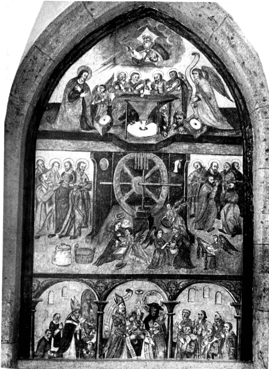
4 Siezenheim (Bezirkshauptmannschaft Salzburg), Pfarrkirche Hl. Maria. Hostienmühlbild (Südwand des Chores). 1. Hälfte 17. Jh.?

den Attribut des Papstes. Die Gruppe der Arbeitenden dagegen erhält ihre Legitimation durch das tätige Mitwirken der hl. Dreifaltigkeit. – Im «Sermon von den guten Werken» und in der Adelschrift von 1520 hatte Luther der katholischen Werkgerechtigkeit die alltägliche Berufsarbeit als Gottesdienst und Dienst am Nächsten gegenübergestellt und so zur Freisetzung eines ungeheuren ökonomischen Potentials beigetragen 22 . Das neue Arbeitsethos findet seine Formulierung auch in den werktätigen Evangelienbäckern des Holzschnitts: Die Arbeit an der Mühle (die Verbreitung des Evangeliums) wird vom Bauern-, Handwerker- und Gelehrtenstand gemeinsam geleistet. Dieser sozialutopische Zug – die Verbrüderung des mittleren und unteren Standes – ist kennzeichnend für die frühe Phase der Reformation.