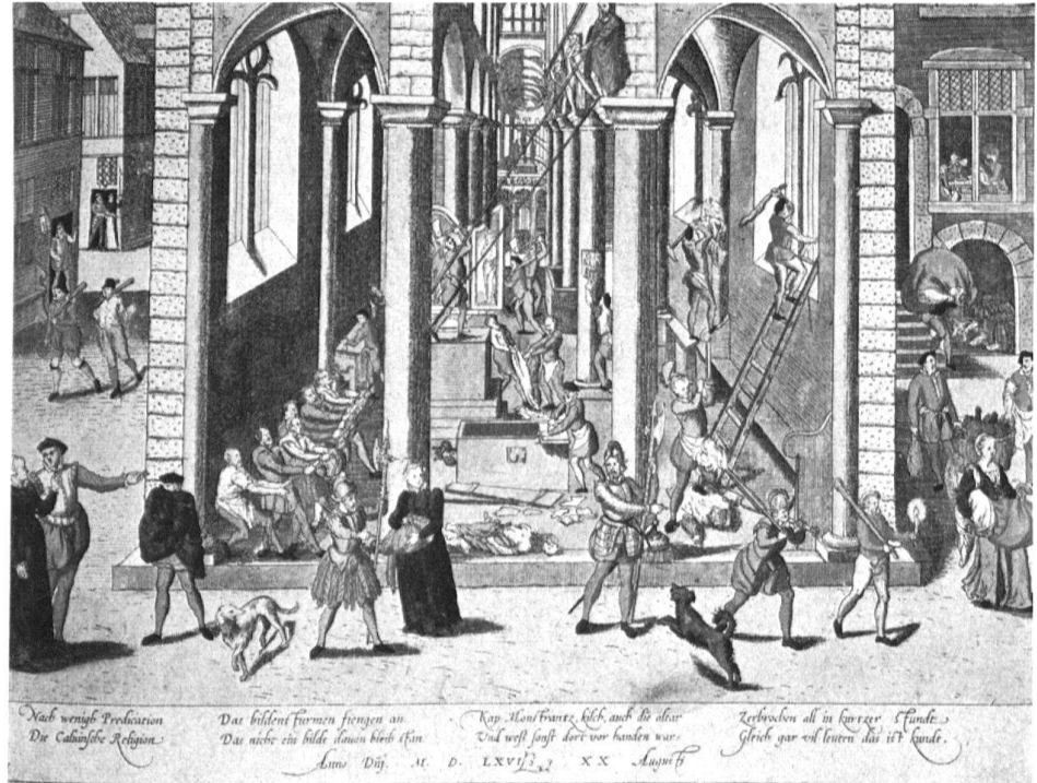
4 Destructions d'images par les calvinistes en 1566. Eau forte de l'atelier de Hogenberg, aquarellée d'époque.