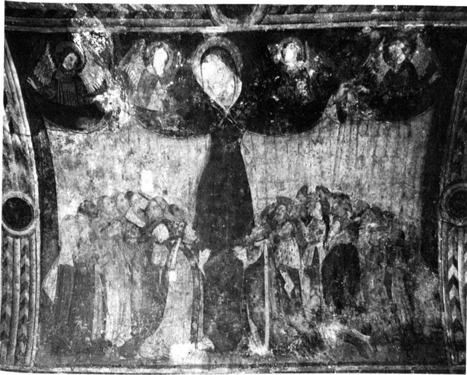
3 Madone de la Miséricorde, atelier de Giacomo Jaquerio, 1446-1449. Cette fresque du temple de Saint-Gervais fut martelée par les iconoclastes genevois en août 1535 puis recouverte d'un enduit.