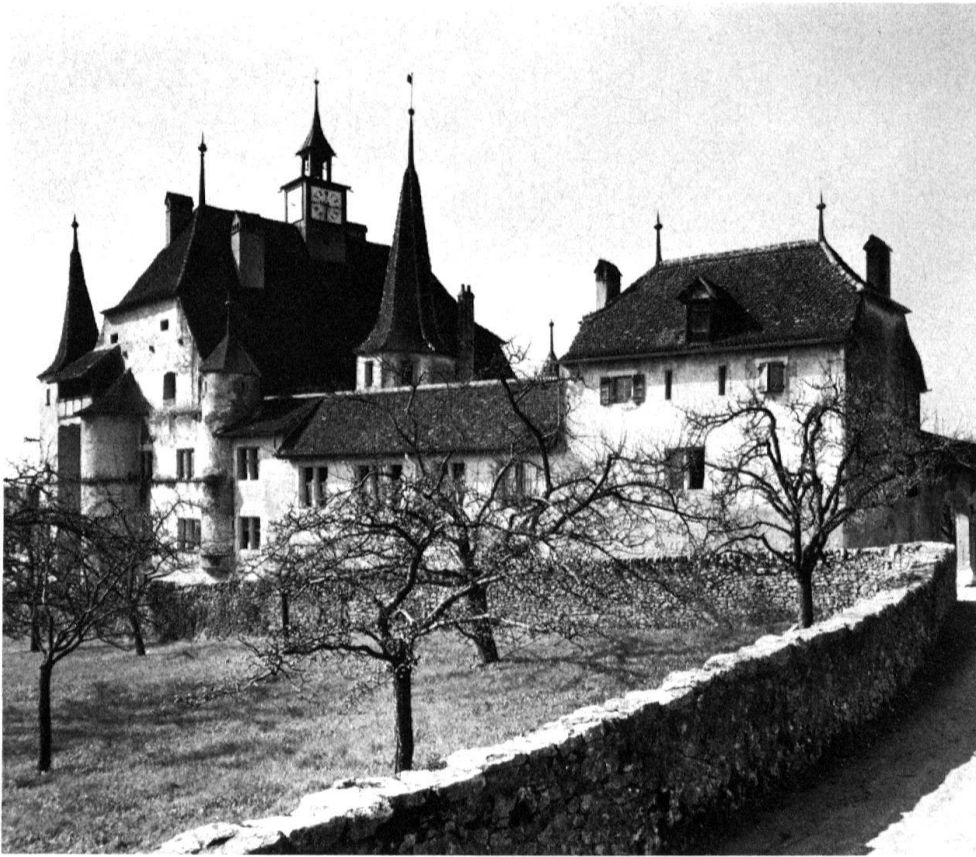
2 Cressier NE; château construit sur un domaine viticole qui représente le statut social de son propriétaire d'une manière typique du 16 e siècle.