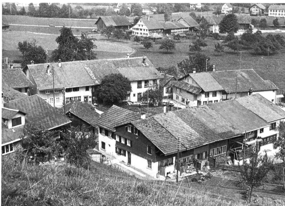
6 Bauma ZH, Undalen. Hameau de la vallée de Töss, très tôt industrialisé avec plusieurs habitations de travailleurs à domicile.

foncière. Elles mettent en lumière le processus dynamique déterminé par la rupture intervenue dans l'agglomération au début du Moyen Age, par la conquête féodale (Erlach réapparaît ici en tant que point de convergence dans son rapport avec le comte de Neuchâtel-Fenis) et enfin par la colonisation intérieure (villages agraires se transforment en villages à plusieurs assolements) ainsi que par l'abandon des villages (disparition) au cours du Moyen Age. En l'occurrence il est tout à fait pertinent de se référer également aux études juridiques de Karl Siegfried Bader sur la morphologie du village médiéval 11 . En effet, c'est sur son instigation qu'ont paru des travaux consacrés à la constitution et à la réforme agraires qui ont beaucoup contribué à l'étude des habitations et de l'habitat 12 . Certains de ces apports permettent de compléter le large éventail scientifique; par exemple les interprétations économiques et de statistiques démographiques intégrées dans une perspective historique d'un Otto Sigg, qui présente les problèmes démographiques, agraires et sociaux existant au XVI e siècle dans la région zurichoise 13 . Cette étude développe les travaux des pionniers zurichois, Werner Schnyder et Paul Guyer dans une perspective moderne. Il faut mentionner également la thèse d'Anne Radeff 14 consacrée à l'arrière-pays de Lausanne au XVII e siècle, et les questions analogues que François Walter pose au paysage fribourgeois à l'époque de la Révolution helvétique 15 .