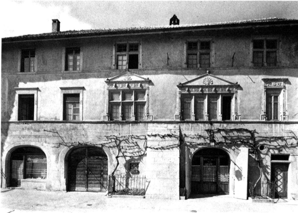
4 Colombier NE, maison de vigne caractéristique du vocabulaire architectural de la renaissance neuchâteloise; expression de l'aisance économique et sociale de son propriétaire.

sation et l'industrialisation ont entraîné l'apparition de nouvelles couches sociales qui ont modifié de manière durable le système social de certaines régions. Enfin, il reste à mentionner le rôle modeste qu'assumait le domaine urbain. La monétarisation de l'économie a, dans une large mesure, elle aussi contribué à la promotion d'une culture individualiste (mobilité de la propriété et des biens). Dans ce contexte, les types d'architecture rurale prennent une signification particulière et l'architecture rurale se présente comme le résultat d'un conflit à l'intérieur de la communauté, opposant traditionalisme anonyme et volonté d'expression individuelle. Ceci s'applique également aux commandes et réalisations architecturales. Considérée sous cet angle, l'analyse fonctionnelle de Richard Weiss «Häuser und Landschaften der Schweiz» parue en 1959 5 , ouvre la voie à une étude détaillée de l'architecture rurale, mais elle n'a pas été poursuivie malgré la tentative de Max Gschwend qui présenta en 1971 un aperçu des maisons paysannes suisses 6 . Si l'on choisit cependant les thèses de Weiss comme point de départ, on reconnaît les qualités exceptionnelles que présente la vision globale de ce spécialiste hors pair de la culture populaire. Nous allons donc proposer quelques réflexions de principe sur l'architecture rurale à partir de quelques cas particuliers qui ne recouvrent en aucun cas tout le champ considéré.