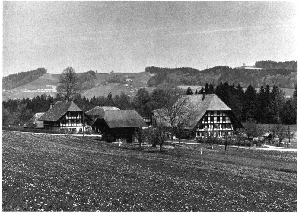
5 Rüderswil BE, Toggelbrunnen. Ferme intacte d'un paysan-propriétaire dans l'Emmental; groupement de bâtiments de fonctions différentes.