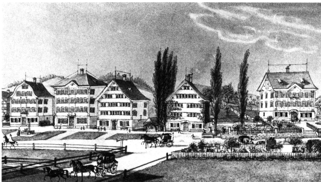
7 Bühler AR, Schopfen. Habitations de négociants textiles alignées et très proches les unes des autres, chacune des façades présente un caractère particulier.

approchés et moins encore compris, sans une vision globale qui inclue l'architecture non-rurale et qui réunisse les domaines antithétiques que sont la culture collective et la culture individualiste. En tant qu'édifice, la maison, produit anonyme ou individualisé, est tout autant chargée de signification que les œuvres de grande architecture (hôtels de ville, etc.) ou celles de l'architecture industrielle (manufacture, villa d'industriel, logements ouvriers). Le travail interdisciplinaire se révèle là aussi extrêmement fécond.