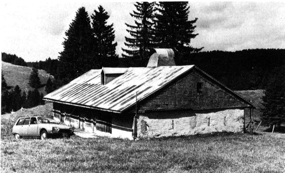
8 Commune du Chenit. Chalet de la Petite Mey- lande. Alpage du «pre- mier étage d'estivage» à la Vallée de Joux, pro- priété privée.