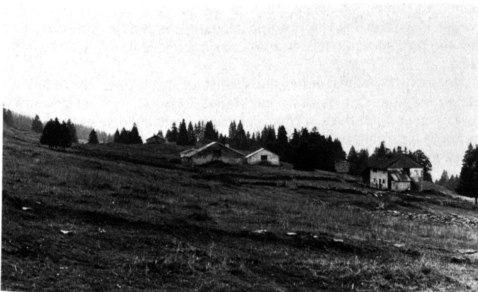
9 Commune d'Arzier. Alpages du village fran- çais de Bois d'Amont, au lieu-dit «Sur la Côte».