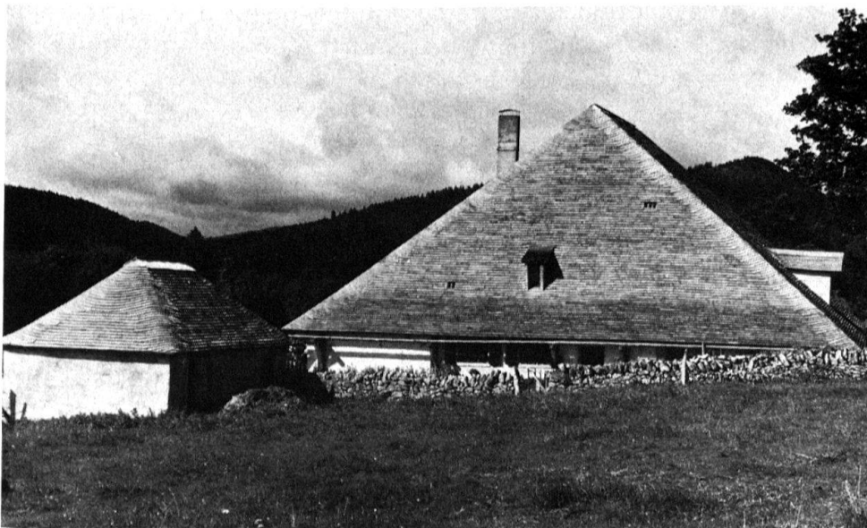
5 et 6 Commune de Provence. Chalet de la Redalle. Couverture en tavillons.