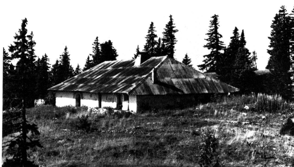
2 Commune de Bière. Chalet du Mont-de-Bière Devant.

Les couches de l'«écurie» sont constituées par des planches posées à même le sol; les bêtes sont placées en rangs, le plus souvent deux groupes de deux rangs opposés et séparés par une rigole permettant l'évacuation du lisier. De l'«écurie», on entre directement dans la fromagerie appelée cuisine, grâce à une ou deux portes percées dans le mur de séparation; cela évite aux bergers des déplacements inutiles lorsqu'ils apportent le lait de la traite. La cuisine est le local central