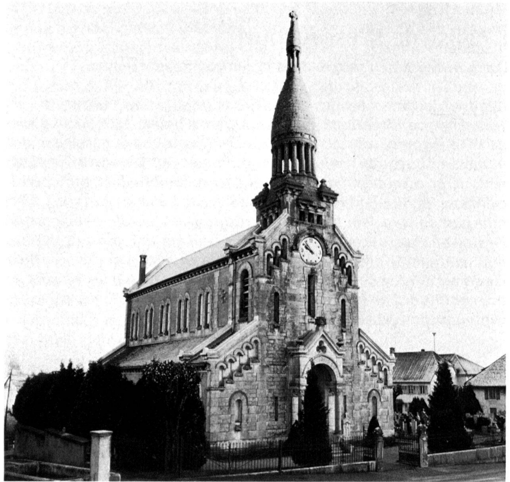
1 La façade principale de l'église de Bressaucourt et son clocher.

une importance monumentale, que l'emploi exclusif de la pierre de taille souligne complaisamment. Sa structure, en l'occurrence, est l'expression des dispositions intérieures du bâtiment: elle comprend en effet une triple division, marquée de chaînes de pierre, qui correspond à la nef principale et aux bas-côtés. Pour animer le mur qui se rapporte à ces derniers, une étroite fenêtre en plein cintre, aveugle, à claveaux droits, s'ajoute à l'arcature formée de cinq petites baies, aveugles elles aussi, mais avec une archivoltte, qui suit le rampant de la toiture. A la base de la partie centrale, la porte est encadrée par un porche à deux colonnes dressées sur des soubassements entre lesquels est inséré un perron de quatre marches; ces colonnes supportent un arc lui-même surmonté d'un fronton triangulaire, percé d'une ouverture trilobée. Au-dessus de ce porche, l'on retrouve, de part et d'autre, une haute fenêtre en plein cintre au-dessus de laquelle rampe une arcature. Une baie rectangulaire, un cadran d'horloge à demi inscrit dans une moulure et trois petites ouvertures à la hauteur des cloches marquent l'axe de la tour. Celle-ci, de souche carrée, est couronnée d'un dôme affectant la forme d'un cône ou d'une tiare, qui est juché sur un tambour à seize colonnes s'élevant entre quatre petites pyramides. Le lanternon, enfin, se compose de six colonnettes et d'un petit dôme semblable au précédent, terminé par une croix pattée.