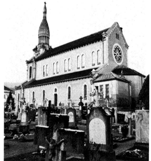
5 Vue d'ensemble depuis le nord-ouest.