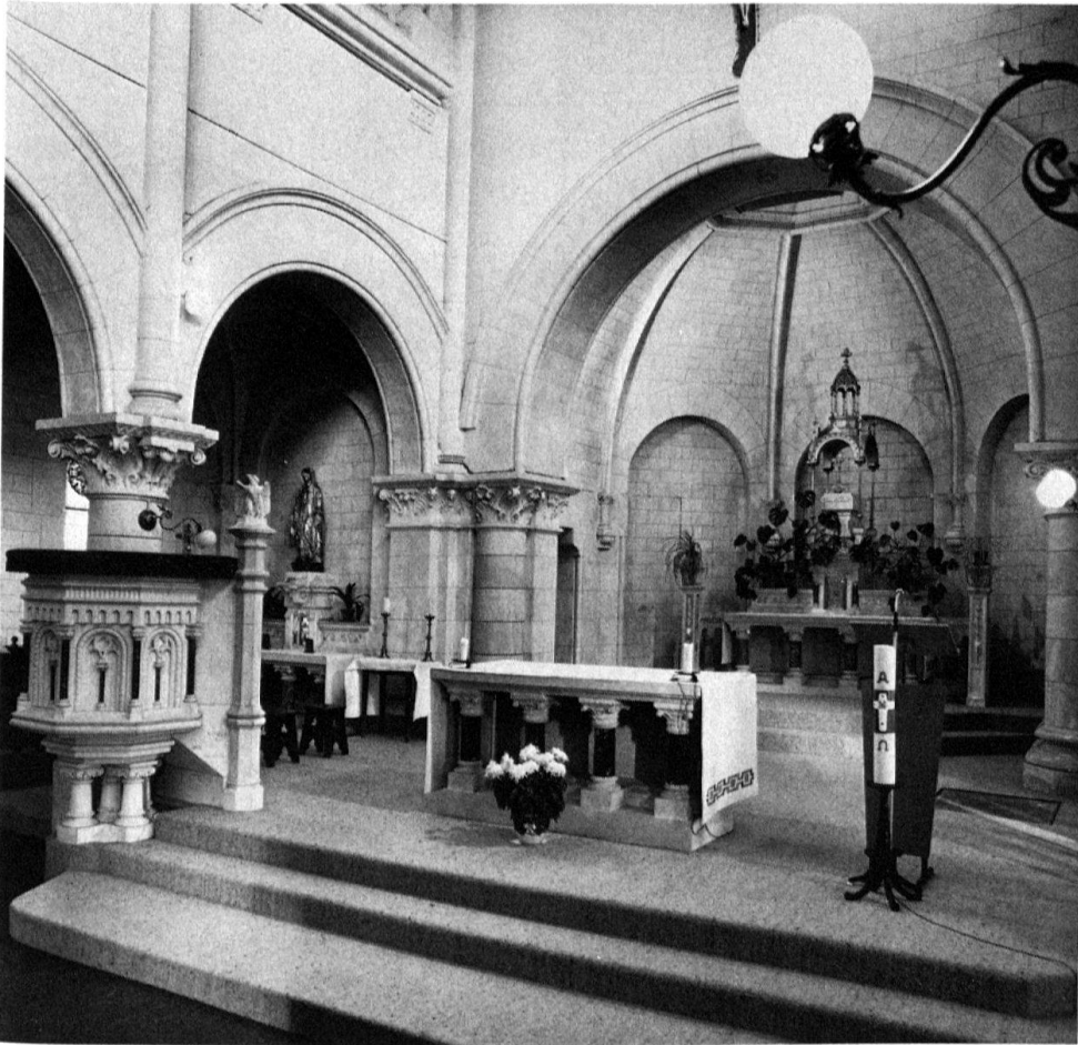
2 Vue du chœur avec le maître-autel, à l'arrière-plan, et l'ambon, à gauche.

pues aux chapiteaux à crochets. A partir des tailloirs, des colonnes engagées s'élèvent jusqu'à la retombée des doubleaux et nervures. Le chœur, très resserré, est moins lumineux que la nef, malgré une ouverture zénithale au-dessus du maître-autel. Murs, voûtes, arcs et colonnes sont tous revêtus d'un enduit blanchâtre à faux appareil.