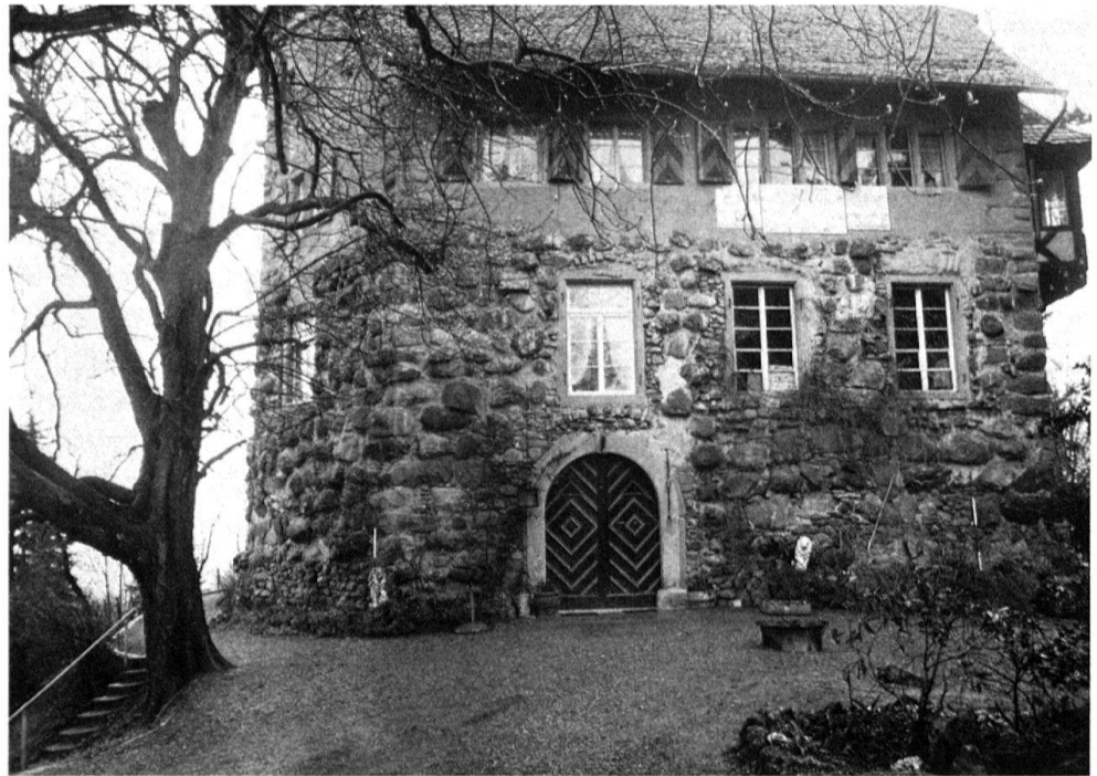
2 Wellenberg (Wellhausen TG). Wohn- oder Wehrbau auf rechteckigem Grundriss mit Findlingsmauerwerk.

geschlossen werden. Die Wahl unter diesen Bautypen beleuchtet die Haltung beziehungsweise die Möglichkeiten der mittelalterlichen Bauherren.