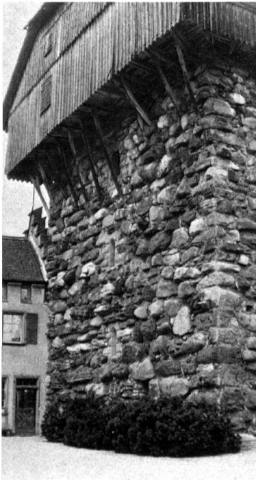
1 Mammertshofen (Roggwil TG). Teilweise bewohnter Wehrturm mit Megalith- bzw. Findlingsmauerwerk.