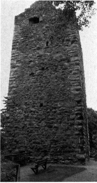
5 Laufenburg AG, unbewohnter Wehrturm mit ehemals wohl teilverputzter Mauerfläche und hervorgehobenen Ecken.

über Angriffen beziehungsweise Ausbruchversuchen an der Mauer. Solche Wünsche führten die Turmbauer eher zu dichtem, möglichst planem Mauerwerk, also vom Megalithischen weg zur Quaderbauweise. Die an Findlingsbauten teils mit Steinsplittern, teils nur mit Mörtel ausgestrichenen Fugen zeigen das Bestreben auf, die Nachteile dieses Bauens wettzumachen. Dass sowohl Quaderbauten wie auch Bruchsteinmauern, die man durchaus völlig plan hätte bauen können, da und dort, insbesondere an den Ecken, Buckel erhalten, ist allerdings ein deutliches Zeichen, wie sehr der Steinbuckel dem Wehrbau als Ausdruck seines Charakters anhing. Diese Feststellung gilt nur für den deutschsprachigen Raum; im romanischen Gebiet haben andere Ideale den Wehrbau geprägt.