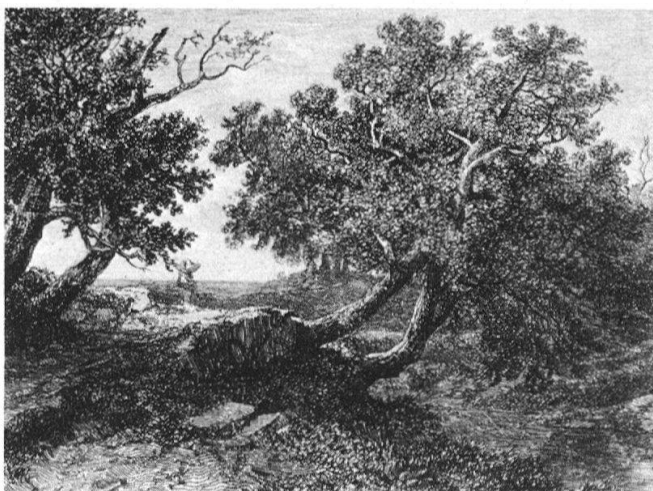
Foto des Autors

Daneben gebrauchte Calame die Lithographie in den Folgen Œuvres (1851–55) und Tableaux (1854–55) für die