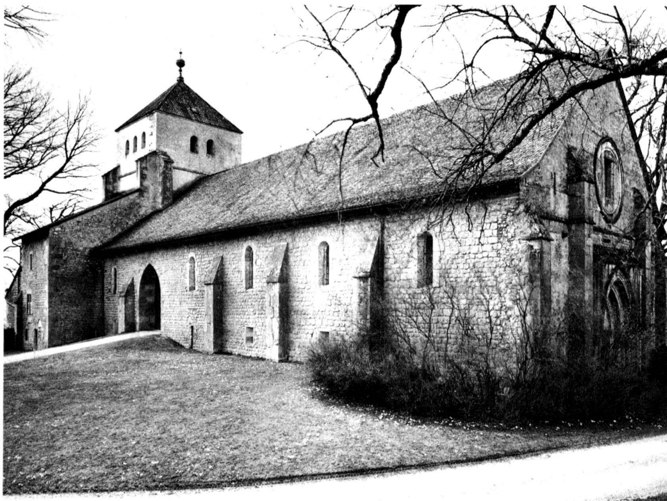
2 Die Zisterzienser- kirche von Bonmont VD.

abgeändert worden war? Die vom Archäologen angeregte Überprüfung des Befundes ergab jedoch, dass der Dachstuhl zusammen mit dem Gewölbe im 18. Jahrhundert aufgesetzt worden war und die durchsägten Balken dem Unvermögen des Zimmermanns zuzuschreiben sind, die komplizierten Verschränkungen der Balken überall mit dem Grundriss in Übereinstimmung zu bringen.