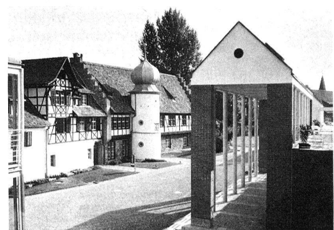
6 Das Kloster Feldbach, bis auf das sog. Refektorium 1895 abgebrannt, ist 1984–1986 durch kristalline, einen Hof bildende Baukuben in Erinnerung gerufen worden.