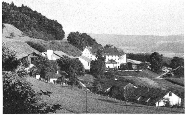
4 Das Kloster Kalchrain, hoch über dem Thurtal gelegen, mit den Wohnungen (im Vordergrund) und den Werkstätten, erbaut 1981–1984.