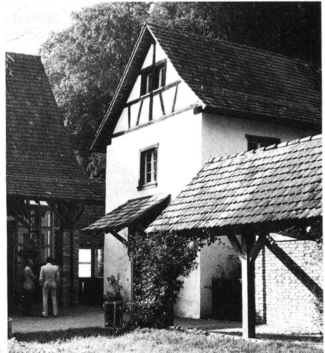
5 Die Sennerei in der Kartause Ittingen, erbaut 1684 und erst teilweise restauriert, wurde um 1980 von Neubauten eingefasst, die sich ins Ensemble einfügen, ohne ihre Eigenständigkeit (trotz Dachvorsprung) aufzugeben.