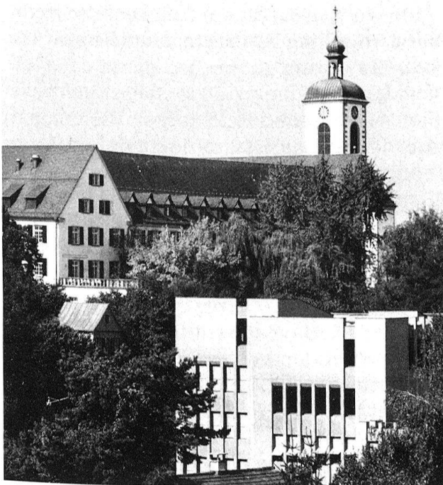
2 Das Seminar Kreuzlingen mit dem 1963–1965 wieder ausgebauten Altbau, dem Gartenhäuschen und dem Neubau von 1969–1972.