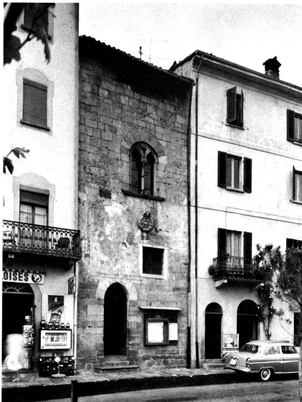
2 «Torre del Capitano», Morcote. Facciata al lago.

trata fino al pavimento del salone principale, il locale del corpo di guardia; al primo piano quello del Capitano (illuminato dalla bella bifora gotica), al quale si accedeva per una scala libera esterna sulla retrofacciata, e al piano superiore il posto di osservazione con probabili merlature e caditoie. La parte superiore della Torre fu demolita nel 1767 perché pericolante.