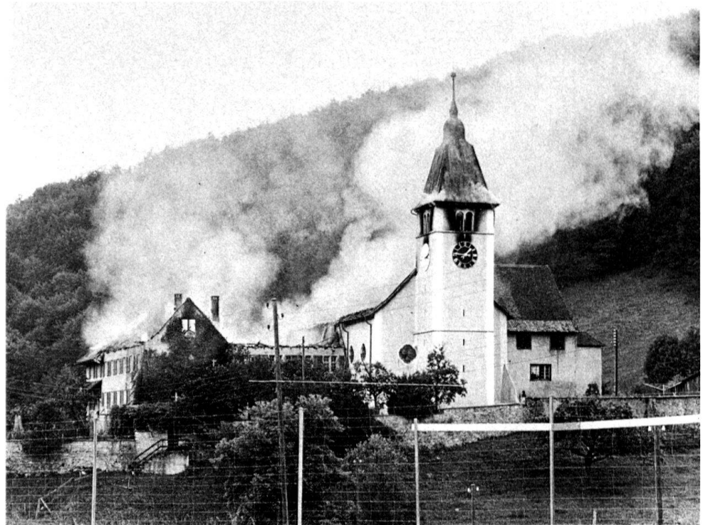
1 Kloster Beinwil während des Brandes vom 4. August 1978.

riert werden! Beispiele von wieder sichtbargemachten zerstörten oder verlorenen Zeichen sind allerdings bekannt. Die Motive sind so unterschiedlich wie zahlreich. Der Akzent verschiebt sich je nach Zerstörungsgrad von der Erhaltung der noch vorhandenen Substanz, z. B. als Mahnmal, bis zur Wiederdarstellung eines noch nicht vergessenen Inhaltes. Wie war das nun nach der Brandkatastrophe von Beinwil am 4. August 1978? Sofort setzte eine engagierte Diskussion ein. Das Stehenlassen der Ruine als Mahnmal wurde von niemandem ernstlich erwogen. Die beteiligten Experten, Eigentümer und Architekten erwogen für die 1668/70 erbaute ehemalige Klosteranlage folgende vier Möglichkeiten: