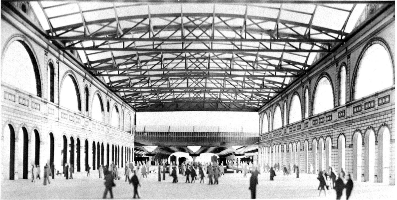
2 Die ehemalige Perronhalle im Hauptbahnhof Zürich, 1865–1871, von Architekt Jakob Friedrich Wanner, wurde 1980 restauriert und soll im Zuge der laufenden Erweiterung der Bahnhofanlage von allen störenden Einbauten befreit und dem reisenden und verweilenden Publikum zur Verfügung gestellt werden. Architekt Ralph Bänziger und Hochbaudienste SBB. (Modellfoto)

Seit gut zehn Jahren profilieren die SBB systematisch ein neues Erscheinungsbild als modernes, zuverlässiges, kunden- und umweltfreundliches Verkehrsunternehmen. Das betrifft z. B. die Gestaltung des Rollmaterials und der Uniformen, die Gebrauchsgrafik und nicht zuletzt das Bestreben nach hoher Qualität in der Architektur 4 . Hierzu steht in einer Weisung der Generaldirektion SBB zum Erscheinungsbild 5 als eine der verlangten Massnahmen: «Historische Bausubstanz schonen unter Berücksichtigung betrieblicher und kommerzieller Anforderungen».