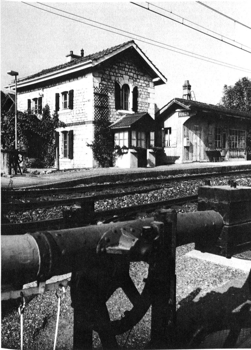
3 Russin, ein Bijou an der Linie Genf-La Plaine, eine der kleinsten Stationsanlagen, bestehend aus Wärterhaus (1858) und Wartehalle (1913).