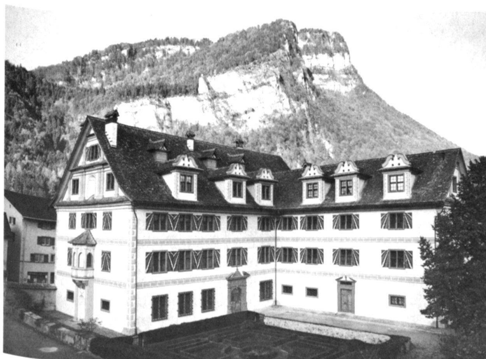
2 Der Freulerpalast nach der Restaurierung von 1983. Die differenzierte Farbgestaltung gab den einzelnen Teilen und der gesamten Architektur ihre klare, kraftvolle Formensprache zurück. Dazu gehören die geflammtten Fensterläden.

1887 renovierte man den Palast Rahns Vorschlägen gemäss. Der Verputz wurde erneuert und ohne farbliche Differenzierung «nach zu bestimmendem Tone» gestrichen. Die Kellerfenster wertete man mit Verzierungen im Steinschnitt auf. Im steilen Satteldach des