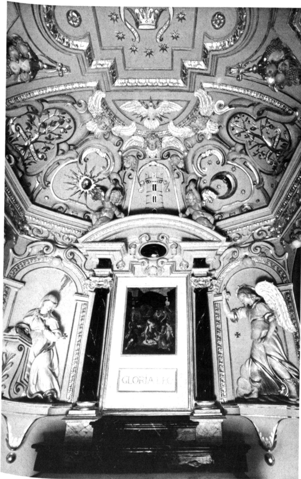
3 Die Kapelle im Freulerpalast. Die frühbarocken Stukkaturen, um 1940 weiss überstrichen, zeigen wieder die ursprüngliche farbliche Fassung und Vergoldung.

Waagrechten und Senkrechten gliedern. Sämtliche Fensterläden mussten nach einem originalen Vorbild neu angefertigt werden. Mit der geflammten Bemalung sind sie ein wesentlicher Bestandteil der Fassadengestaltung und der vom Erbauer beabsichtigten künstlerischen Gesamtwirkung.