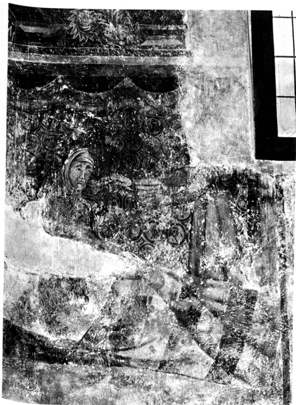
3 Chironico, il rimprovero ad Anna (o lite tra Anna e la serva) qui contaminato da elementi della nascita di Maria.

figure coricate, e, per gli abiti che portano (il volto risulta cancellato nel primo episodio), le due serve. Solo la tappezzeria di fondo che chiude la scena è diversa; mentre nella nascita essa si caratterizza da un semplice motivo a rombi, nell'altra scena essa presenta una elegante decorazione a tondi ripetuti che circondano stilizzati animali araldici.