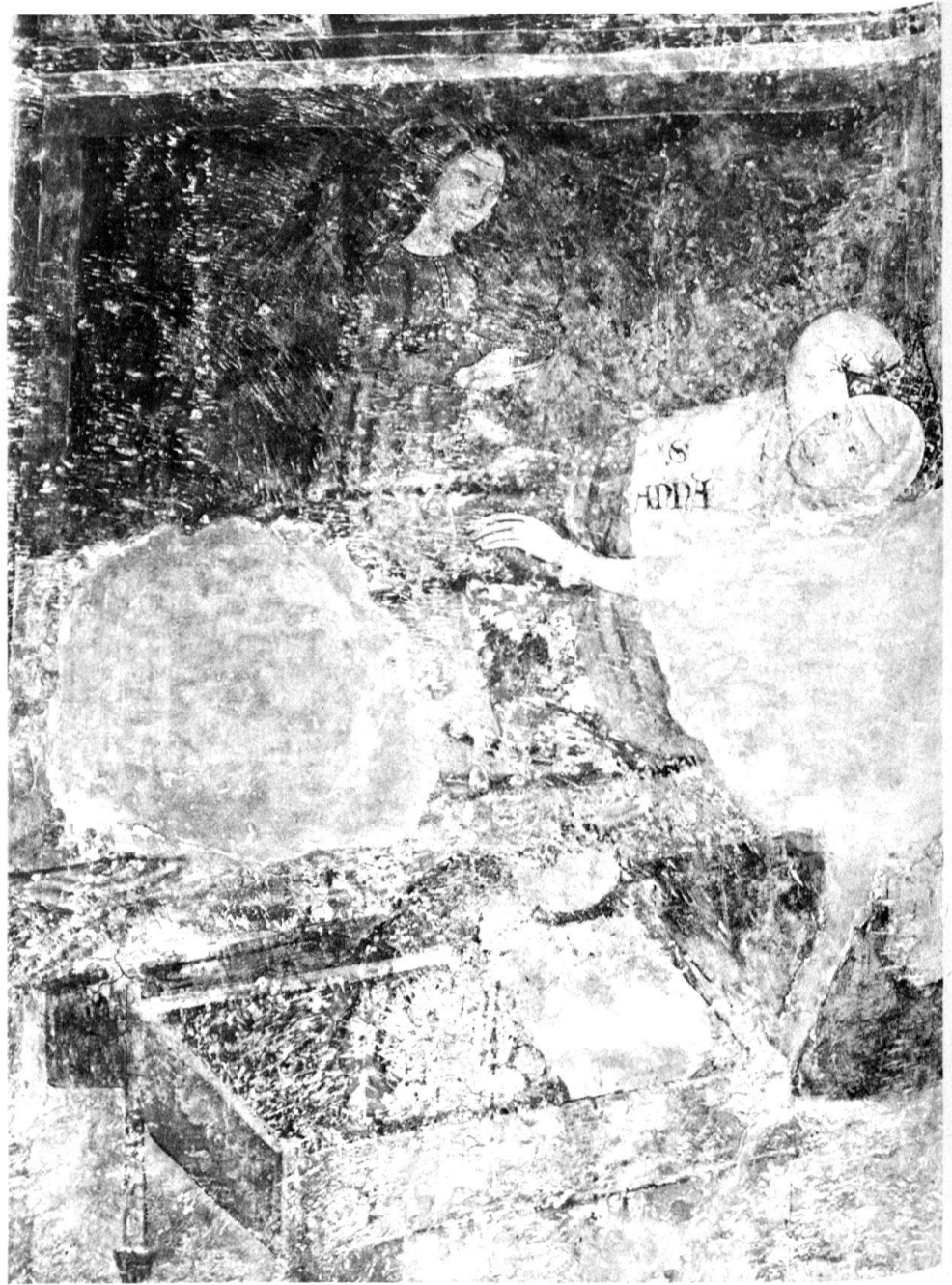
2 Chironico, nascita di Maria.

che trascina un cavallo da soma mentre la parte destra è riservata all'incontro tra i due sposi che sotto l'arco della porta si abbracciano teneramente, mentre sullo sfondo si scorgono tetti, finestre (mono e bifore a tutto sesto) e torri merlate della città di Gerusalemme.