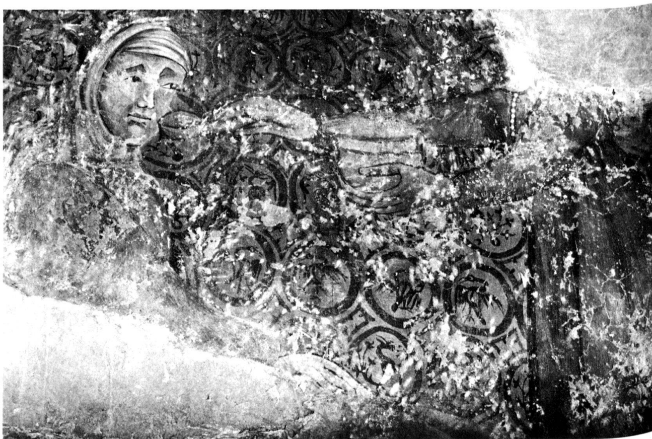
4 Chironico, il rimprovero ad Anna (particolare della tapezzeria).

sente in modo esplicito nella tradizione bizantina divulgato dal «Protovangelo di Giacomo», testo che per primo ha narrato le vicende di Anna e Gioacchino. Risulta invece assai più raro nell'agiografia occidentale dove appare citato in modo sfuggente unicamente nello «Pseudo Matteo», opera che con il «Vangelo della natività» (che non ne fa menzione) svolse in occidente lo stesso ruolo divulgativo del «Protovangelo di Giacomo» 6 .