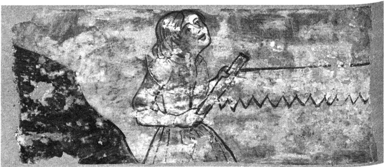
5 Bellinzona. Albergo del Cervo. Particolare del soffitto.

si differenziano da quelle viste in precedenza per il gioco scherzoso che instaurano con il soffitto: nelle prime vediamo infatti una ragazza da un lato e un giovane dall'altro che, azionando una lunga sega, mostrano di voler segare una trave del soffitto, situata al centro. La burla è semplice, ma possiede un suo significato morale comprensibile alla rovescia, ricordando la tematica matrimoniale della decorazione circostante. In realtà gli attori non sono boscaioli, come il soggetto vorrebbe, ma una giovane coppia di fronte alla vita, durante la quale dovrebbe cercare di costruire e non di distruggere. Nelle ultime due tavolette ritroviamo uno scherzo analogo: due giovani fingono di sostenere le travi del soffitto, uno con il dorso e l'altro con le braccia. In forma leggermente diversa anche questo motivo ritorna nelle stampe posteriori, dove vediamo ad esempio un uomo che sostiene la propria casa cadente con le sole braccia 19 .