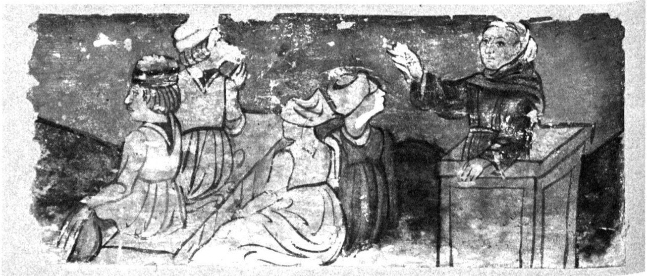
3 Bellinzona. Albergo del Cervo. Particolare del soffitto.

III.4 tano i suoi insegnamenti, dandoci un esempio di trasgressione della norma che, capovolto e letto nel giusto senso, diviene un'esortazione a seguire la morale del predicatore. Nella seconda tavoletta, tanto la posizione dei fedeli quanto quella del religioso subiscono un'inversione caricaturale. Al posto del predicatore troviamo una figura molto familiare al pubblico medievale: l'eroe principale del Roman de Renart , ovvero la volpe, nota nel mondo italiano con il nome di Rainaldo, e di fronte a lui un singolare pubblico di fedeli, formato da sei oche con il contapregchiere in bocca e una settima, già sedotta dal furbo monaco, raffigurata nel cappuccio di Rainaldo.