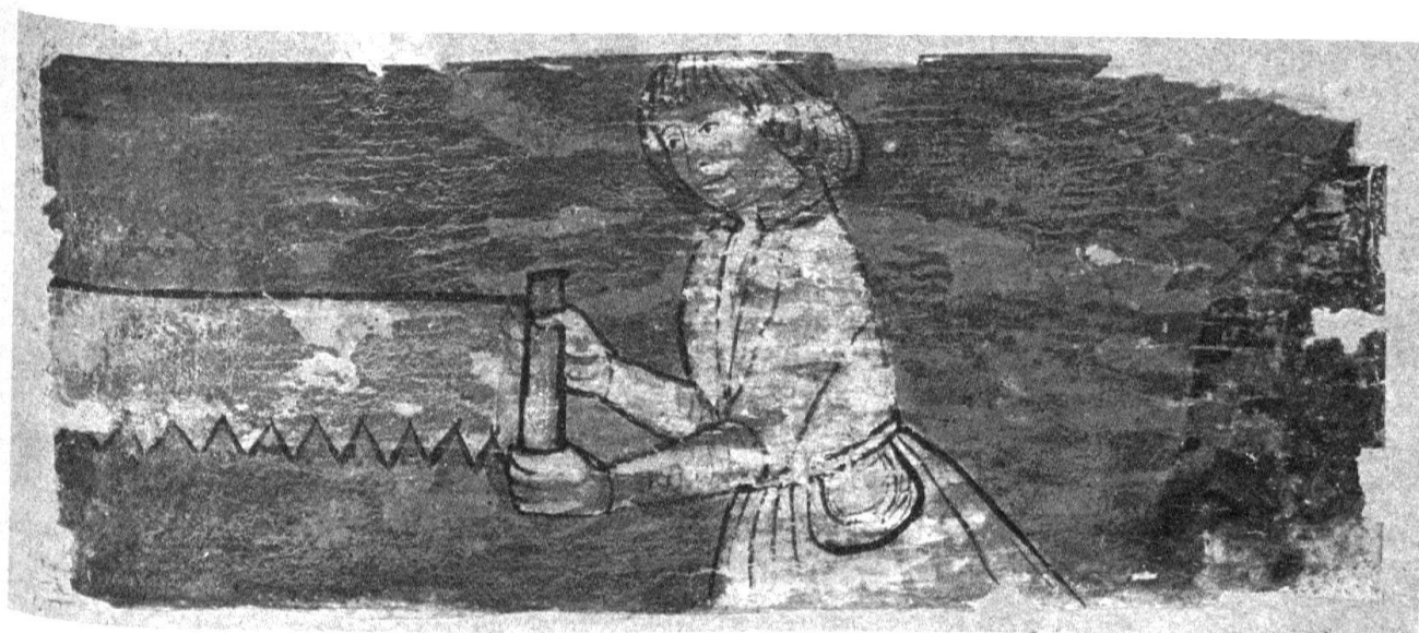
6 Bellinzona. Albergo del Cervo. Particolare del soffitto.