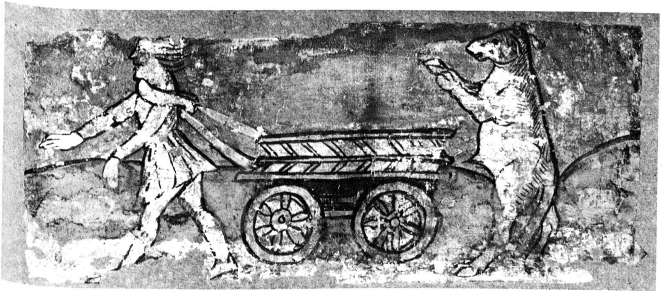
2 Bellinzona. Albero del Cervo. Particolare del soffitto.