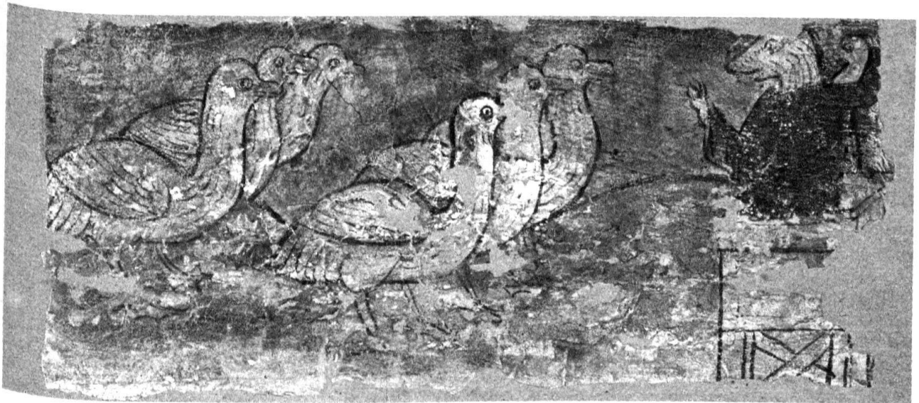
4 Bellinzona. Albergo del Cervo. Particolare del soffitto.

viepiù su Rainaldo che, riunendo in sé l'ipocrisia e la furbizia proverbiali, assume un valore simbolico universalmente riconoscibile. Questo tratto del suo carattere fornì il nesso con una delle tematiche più sentite dall'uomo del Medioevo, ossia l'ipocrisia religiosa. Non stupisce pertanto la frequenza con la quale troviamo Rainaldo in veste di ecclesiastico e principalmente di monaco, considerato poi che buona parte del corpus renardiano fu composto da colti chierici, che sin dall'inizio riservarono al basso clero umile ed ignorante un'immagine negativa. Tale è il caso ad esempio di Renart le bestourné , composto nel 1261, nel quale la critica viene estesa agli ordini mendicanti e Rainaldo, divenuto francescano, incarna l'ipocrisia stessa e le forze infernali che entrano nella Chiesa per sedurre i fedeli e trascinarli nel male 15 . L'immagine di Rainaldo quale francescano astuto e in malafede conobbe un grande successo e nei secoli successivi essa appare tra i temi dominanti dell'iconografia renardiana; possiamo ricordare che, secondo il consuntivo tematico e cronologico allestito da K. Varty, Rainaldo predicatore è tra i soggetti maggiormente rappresentati nel XV secolo 16 . È interessante notare infine che buona parte di queste immagini si trova in ambiti ecclesiastici, in decorazioni di stalli o in marginali di messali e salteri 17 , dove assumeva un valore simbolico senza equivoci e rammentava al clero la minaccia dell'ipocrisia.