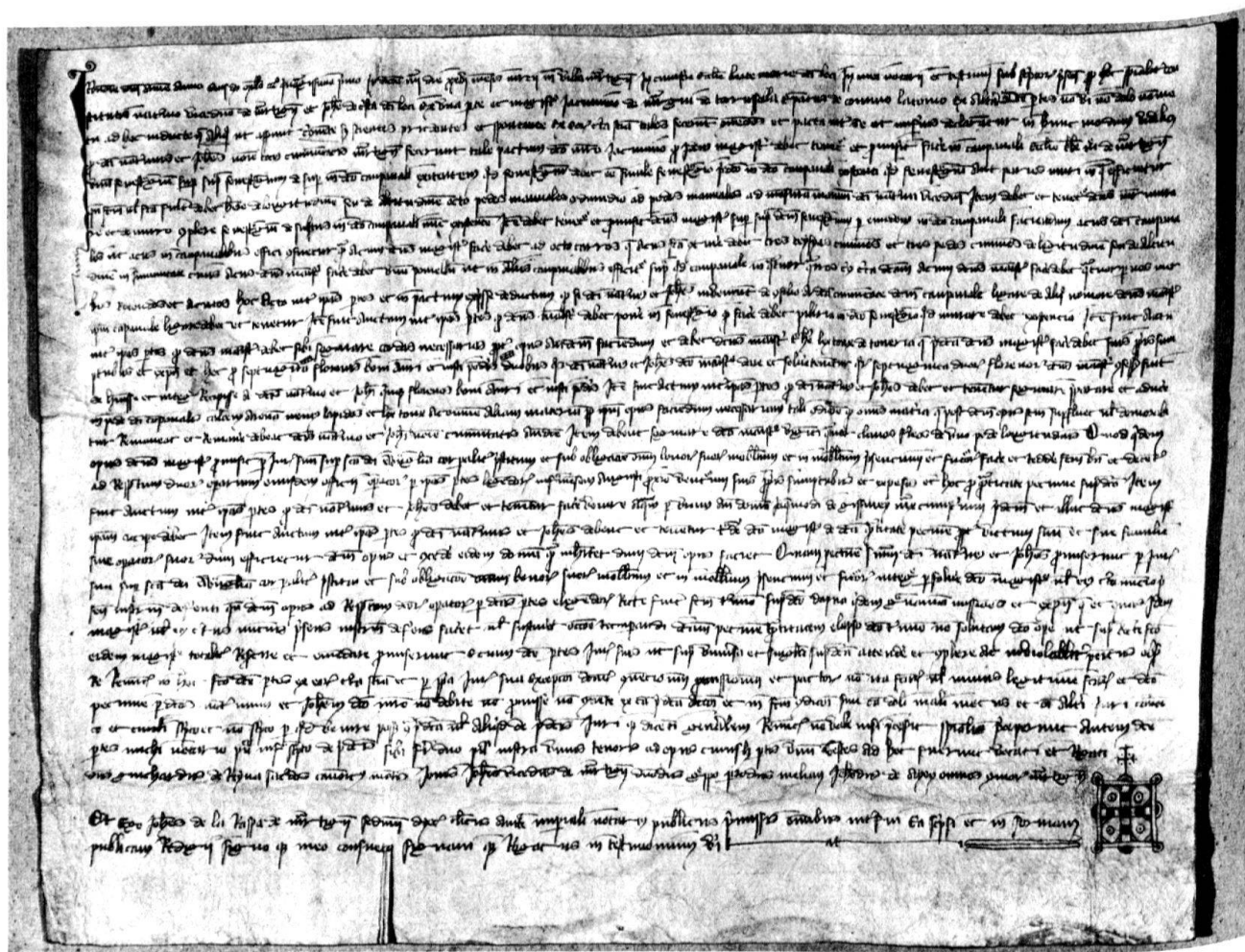
1 Convention du 26 mars 1351 pour le remaniement du clocher de Martigny. Sion, Archives cantonales, Martigny-Mixte, n° 834. Parchemin original.

l'ouvrage et l'extraction du tuf à la carrière ( trahere lex toux de toueria ) incombent au maître.