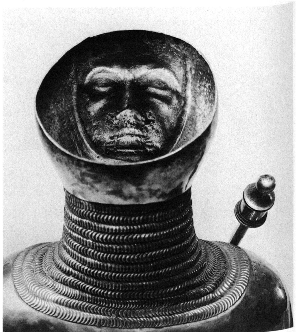
4 Buste reliquaire de saint Victor vu de dos, XV e siècle, trésor de l'abbaye de Saint-Maurice: aspects inattendus: le photographe joue-t-il avec l'objet – ou l'œuvre se joue-t-elle du spectateur?

l'aiguière, compose ses planches avec plusieurs points de vue d'une même partie de la pièce, ce qui permet de la saisir à la fois dans son ensemble et de manière fragmentaire.