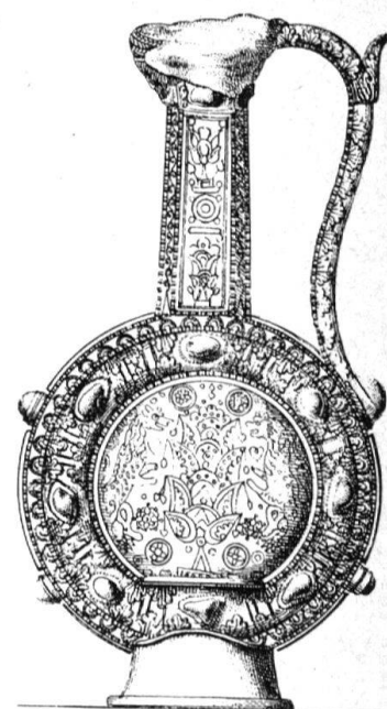
1 Dessin de Balvignac, Jean-Daniel: Histoire de l'architecture sacrée, Lausanne 1853, vol. 1., pl. XV. (pl. XVI: aiguière de profil)